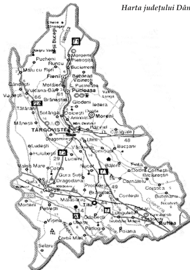
Harta județului Dâmbovița