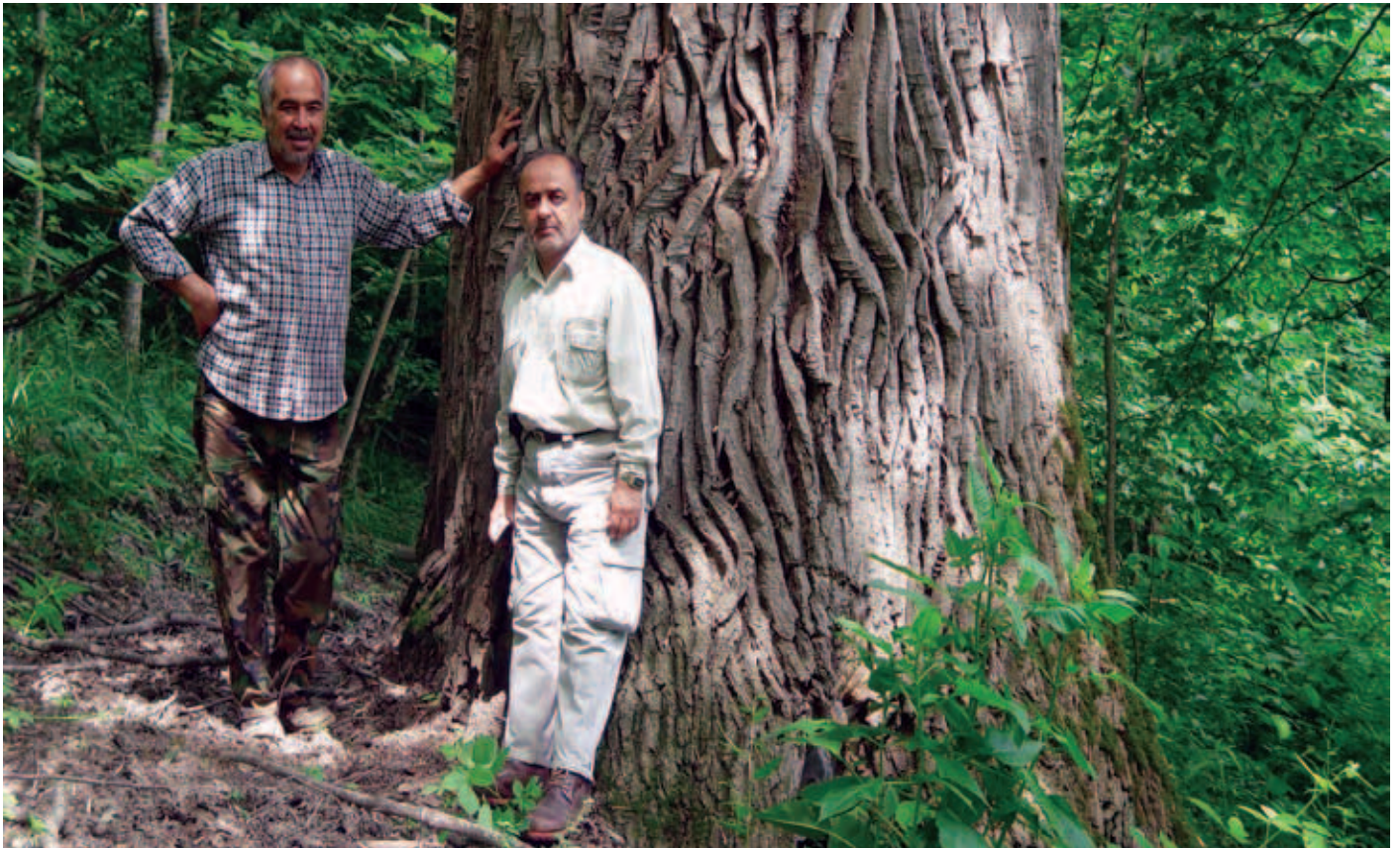
To iranske skovforskere ved gammel eg i blandet løvskov syd for Det Kaspiske Hav.

Spørgsmålet lyder langt ude i skoven, men bag det skjuler sig en interessant historie om istidernes indflydelse på de danske skoves tilpasningsevne, og om muligheden for at hente forbedret genetisk materiale i Iran. Og med en sidehistorie om, hvorfor ædelgran fra Syditaliens bjerge trives bedre i Danmark end ædelgran fra de nærmere skove i Tyskland eller Tjekkiet.