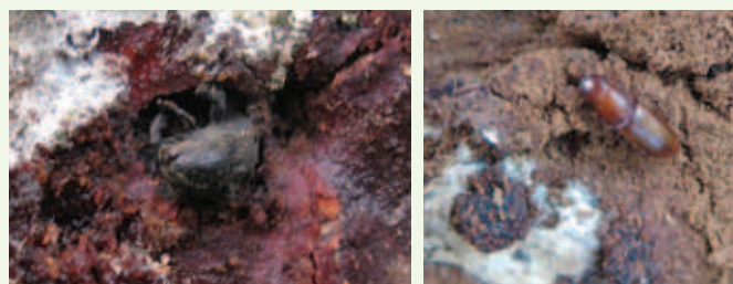
Jættebarkbiller (foto tv.) bliver 7-9 mm lang og yngler under barken på levende sitkagraner. Rovbiller, Rhizophagus grandis (foto th.) kan imidlertid holde jættebarkbiller i skak.