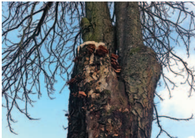
Stor gren brækket af.

I Danmark er sygdommen ikke officielt registreret, hvilket skyldes, at ingen har villet betale de nødvendige laboratorieundersøgelser. Sygdomsbilledet er som i de øvrige lande, og udenlandske eksperter har afsagt dommen.