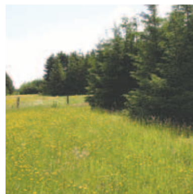
Gl. Kidbæk og Stentoft. Medlem af Skovdyrkerne Vestjylland siden 2000.