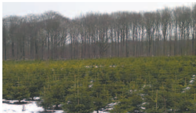
Du kan nu investere i et "Udvidet tilsyn" af dine juletræer – et godt værktøj for juletræsdyrkeren, som ønsker at få mere ud af produktionen.

Skovfogeden kan desuden udarbejde tilsynsrapport ved hvert besøg eller ringe med en direkte afrapportering. Alle foranstaltninger aftales individuelt.