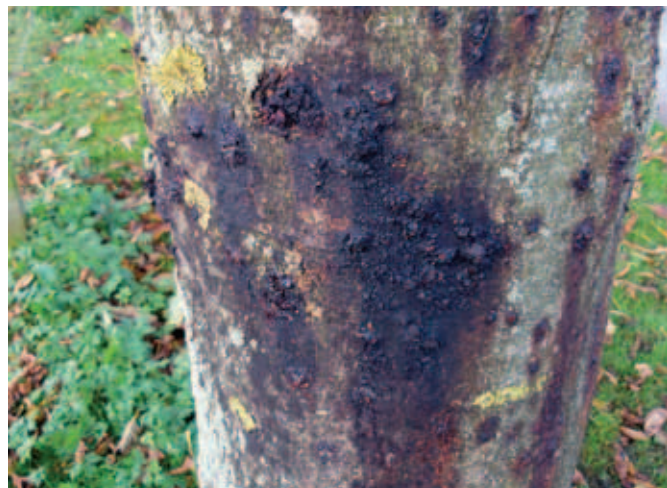
Stamme med slimflåd.