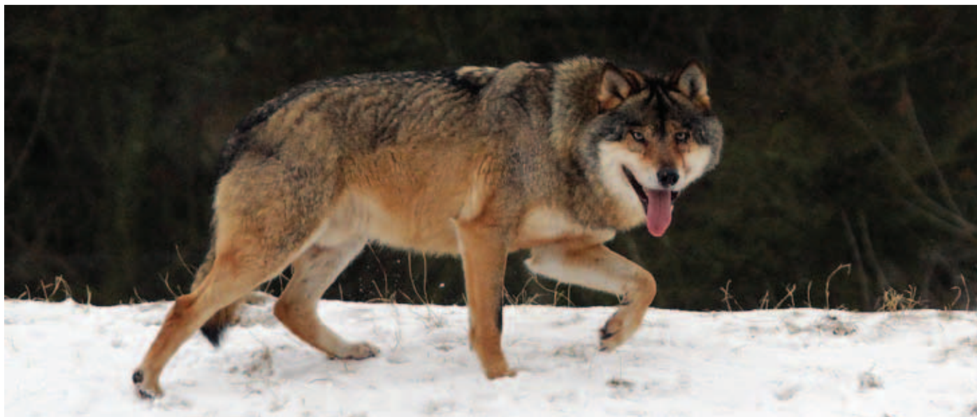
Den går efter sigende ikke på mennesker – men den kan tage din hund.