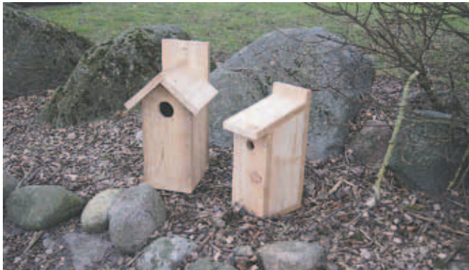
Mejse- og stærekasser kan nu erhverves til meget lave priser gennem skovdyrkerforeningen.

For år tilbage leverede vi over 1.000 fuglekasser til medlemmerne. Flere har nævnt, at "det må vi gerne gøre igen". Derfor har vi indledt et samarbejde med produktionskolen, som nu er klar til at levere både mejsekasser og stærekasser til meget lave priser.