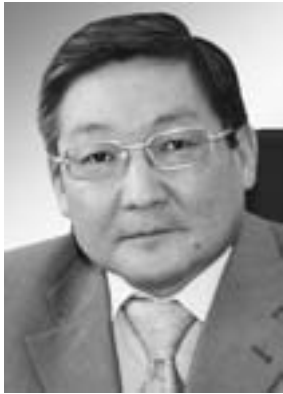
А. Е. Амосов Член редакционной коллегии БЭС Краснояр- ского края. Председатель комите- та Законодательного собрания Красноярского края по коренным и малочисленным наро- дам Севера.