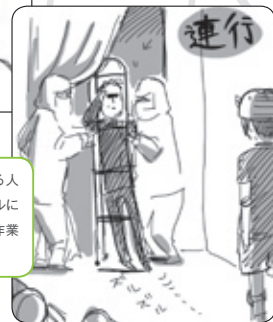
スルホロバスと呼ばれる人その2。ツヴァルクベセルに入ったテラヴスの撮収作業 (イラスト提供:イオさん)