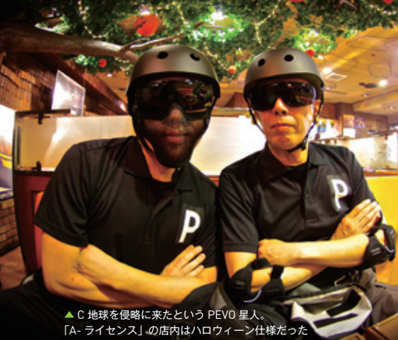
▲C 地球を侵略に来たという PEVO 星人。「A-ライセンス」の店内はハロウィーン仕様だった