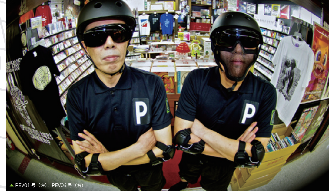
▲ PEVO1 号 (左)、PEVO4 号 (右)