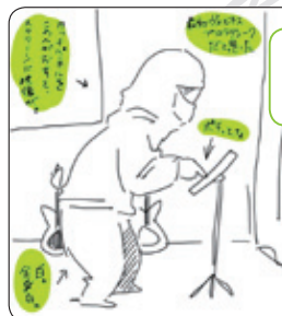
スルホロバスと呼ばれる人その1。ステージ上の機材を操作 (イラスト提供:イオさん)