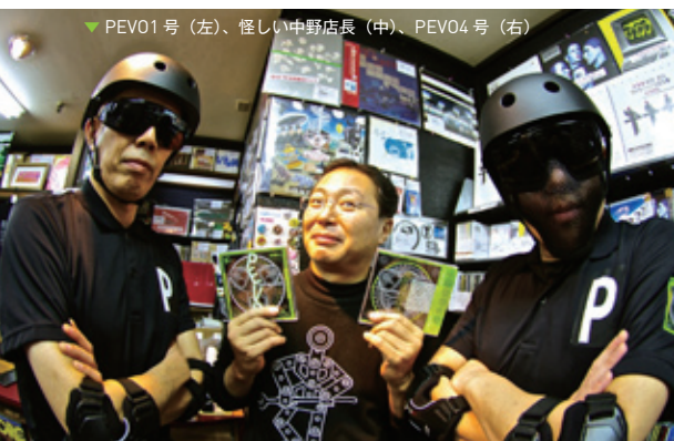
▼ PEVO1号 (左)、怪しい中野店長 (中)、PEVO4号 (右)