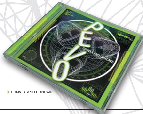
▶ CONVEX AND CONCAVE

(この取材は 2012 年 10 月 28 日 14 時頃より、約 2 時間に渡って行われた)