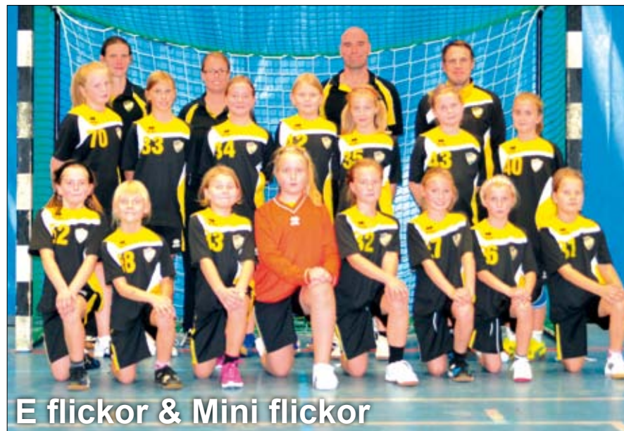
E flickor & Mini flickor