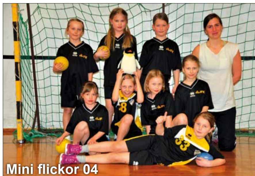
Mini flickor 04