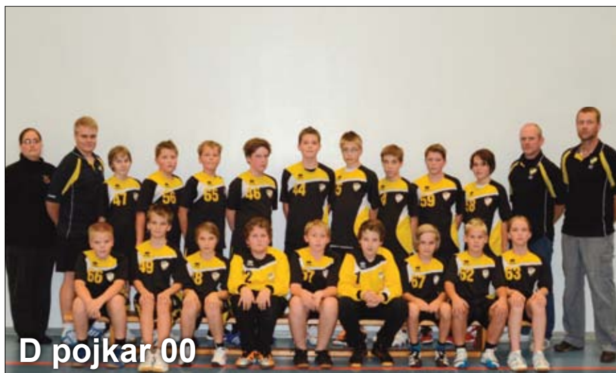
D pojkar 00