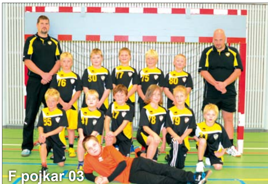
F pojkar 03