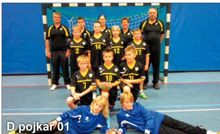
D pojkar 01