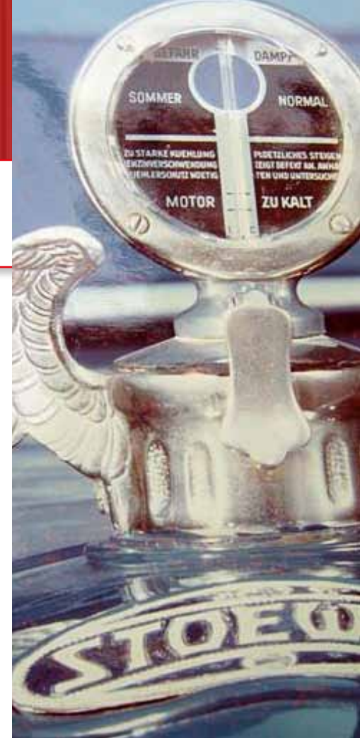
Schlaichs erstes Produkt: Das Kühlerthermometer

Gleichzeitig brachte der ideenreiche Konstrukteur neue Instrumente, wie den Reifenluftdruckprüfer und Industrie- und Ölfernthermometer auf den Markt. Dabei arbeitete Schlaich bei Kombinationsinstrumenten mit dem damals revolutionären Bimetall-Prinzip. Die Instrumente bestanden aus einem Geber und einem Anzeigergerät, die beide mit einem Bimetallstreifen versehen waren. Wurde der Stromkreis geschlossen, brachte es den Bimetallstreifen zum Durchbiegen, löste den Kontakt aus