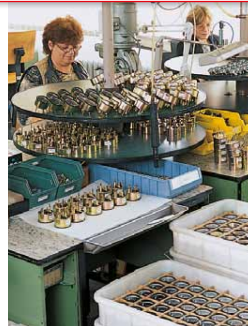
Die Umsetzung individueller Kundenwünsche erfordert spezialisierte Fachkräfte. Dabei ist die Wissensvermittlung bei MOTOMETER eine wesentliche Säule der Firmenphilosophie.

im technischen und im Designbereich. Bei der Arbeit wurde das Optimum angestrebt und damit stand der Wunsch im Vordergrund, das maximal Erreichbare zu schaffen. Um die Flexibilität auch weiterhin zu gewährleisten, gab es neben den weitgehend automatischen Fertigungsverfahren auch die manuellen Arbeitsbereiche mit spezialisierten Fachkräften. Damit einhergehend war und ist der Ausbau und die Sicherung qualifizierter Arbeitsplätze. Seit den 80er Jahren steht das Wir-Gefühl der Mitarbeiter im Vordergrund. Das führte zur bis heute andauernden Steigerung der Identifikation mit dem Unternehmen.