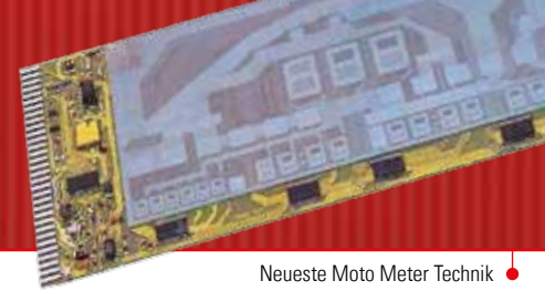
Neueste Moto Meter Technik in den 80er Jahren: Hybridschaltung auf Glas

im technischen und im Designbereich. Bei der Arbeit wurde das Optimum angestrebt und damit stand der Wunsch im Vordergrund, das maximal Erreichbare zu schaffen. Um die Flexibilität auch weiterhin zu gewährleisten, gab es neben den weitgehend automatischen Fertigungsverfahren auch die manuellen Arbeitsbereiche mit spezialisierten Fachkräften. Damit einhergehend war und ist der Ausbau und die Sicherung qualifizierter Arbeitsplätze. Seit den 80er Jahren steht das Wir-Gefühl der Mitarbeiter im Vordergrund. Das führte zur bis heute andauernden Steigerung der Identifikation mit dem Unternehmen.