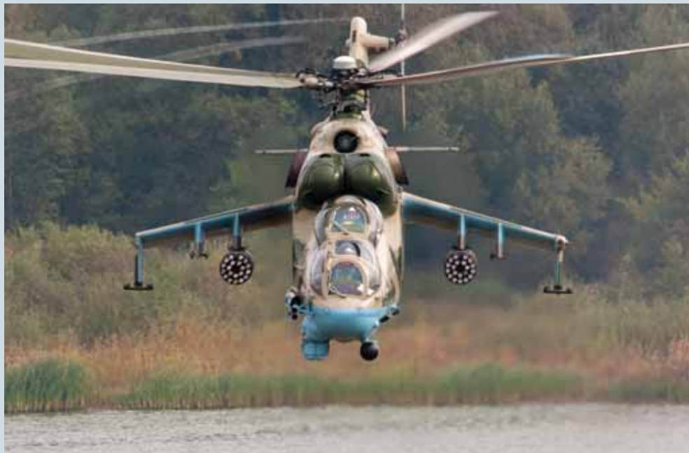
Вихід на ціль Сергій Попсуевич