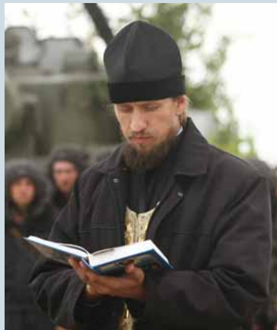
В кожного своя В'ячеслав Рати

Надсилаючи знімок, не забудьте вказати своє прізвище, ім'я та по батькові, вік, електронну та поштову адреси, контактний телефон, назву роботи, а також місце та час зйомки.