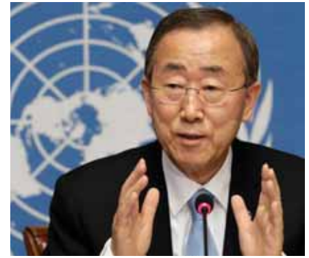
Генеральний секретар ООН Пан Гі Мун

Україна робить значний внесок у миротворчі операції ООН та надає надзвичайно важливі транспортні послуги для наших місій у всьому світі. Зокрема Україна бере найактивнішу участь у військових вертолітних миротворчих операціях у світі. Також у лютому 2011-го Україна у вирішальний момент погодилася перенаправити три атакувальні вертольоти з операції ООН у Ліберії до місії у Кот-д'Івуарі. Українські гелікоптери разом із французькими гелікоптерами з місії «Єдиноріг» виконували свої обов'язки професійно. Безперечно, нейтралізація важкої зброї врятувала життя багатьох цивільних громадян і представників сил ООН. Цей крок був високо оцінений, оскільки він забезпечив надання ресурсів, коли вони були найбільше потрібні.