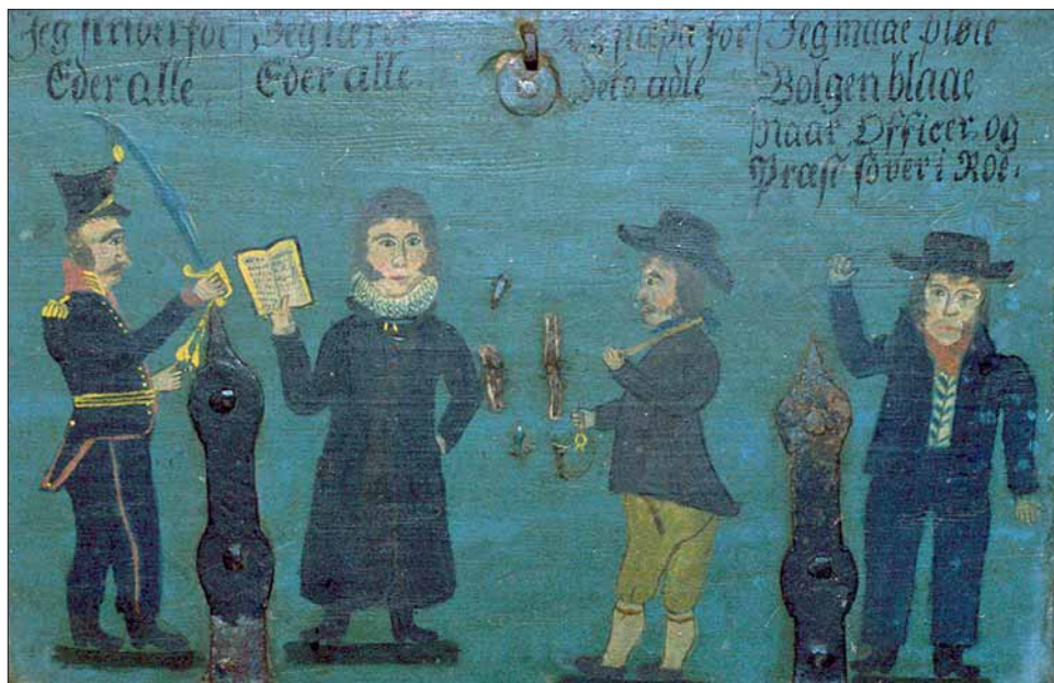
Den sosiale avstanden mellom embetsmennene og allmugen kjem fram i folkekunstens fargerike figurar. Offiseren: «Jeg strider for Eder alle». Presten: «Jeg lærer Eder alle». Bonden: «Eg sløpa for deko adle». Sjømannen: «Jeg maae ploie Bolgen blaae naar Offiser og Præst sover i Roe». Borgundøy, Kvinnherad.