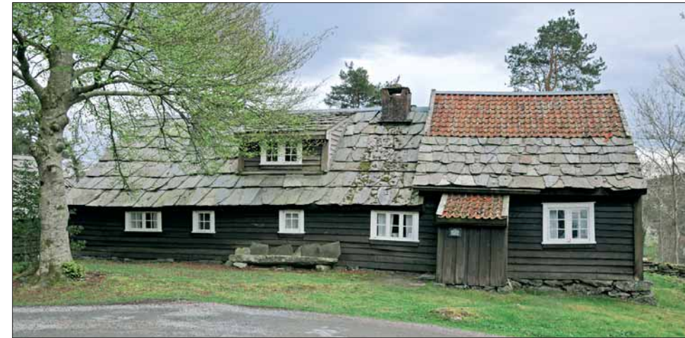
Stovehusa frå futegarden på Sør-Huglo står i dag på Sunnhordland Museum. Denne bygningen skil seg ikkje særleg ut frå dei mange velbygde bondegardane i Sunnhordland.

På 1600-talet tok nye sosiale grupper over leiarposisjonane i samfunnet etter adelen. Embetsmennene og storborgarane vart den økonomiske og sosiale eliten i landet. Embetsmennenes makt og posisjon vart styrkt gjennom utbygginga og sentraliseringa av statsapparatet i Danmark-Noreg ved innføringa av eineveldet