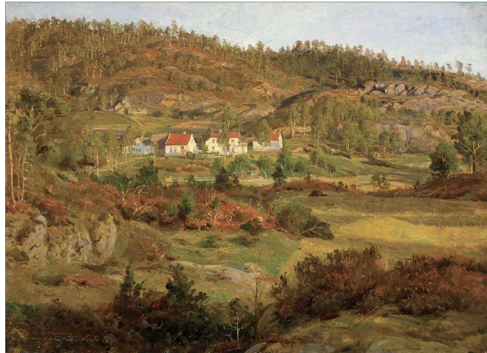
Futegarden Hammarhaug i Olvebygda, måla av Anders Askevold i 1860. Til denne storgarden høyrde seks husmannsplassar som låg spreidde i utmarka. Tidlegare høyrde Hammarhaug til Tysnes kommune.

Einskilde gods og godssamlingar var skilde ut som eigne rettskrinsar og forvaltningsområde, såkalla birk. Godset i eit birk låg ikkje under dei allmenne styresmaktene,