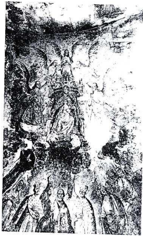
фрагмент росписи фото 1987 года

В сентябре 2006 года за долгие годы забвения был отслужен молебен. Церкви требуется большой капитальный ремонт. Жители села Благовещенье и окрестных деревень надеются, что найдутся меценаты, которые готовы помочь в возрождении храма.