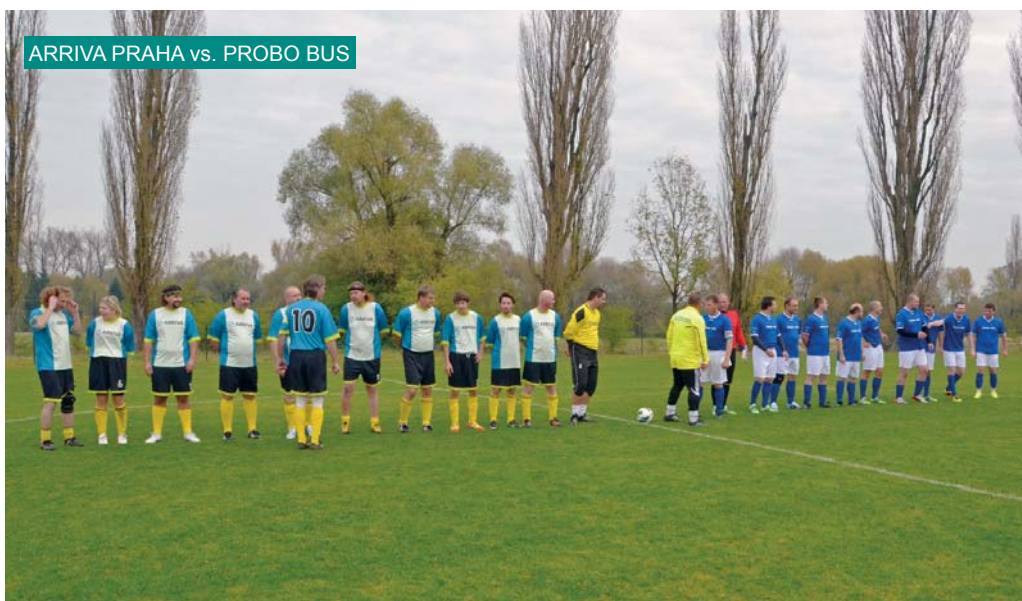
ARRIVA PRAHA vs. PROBO BUS