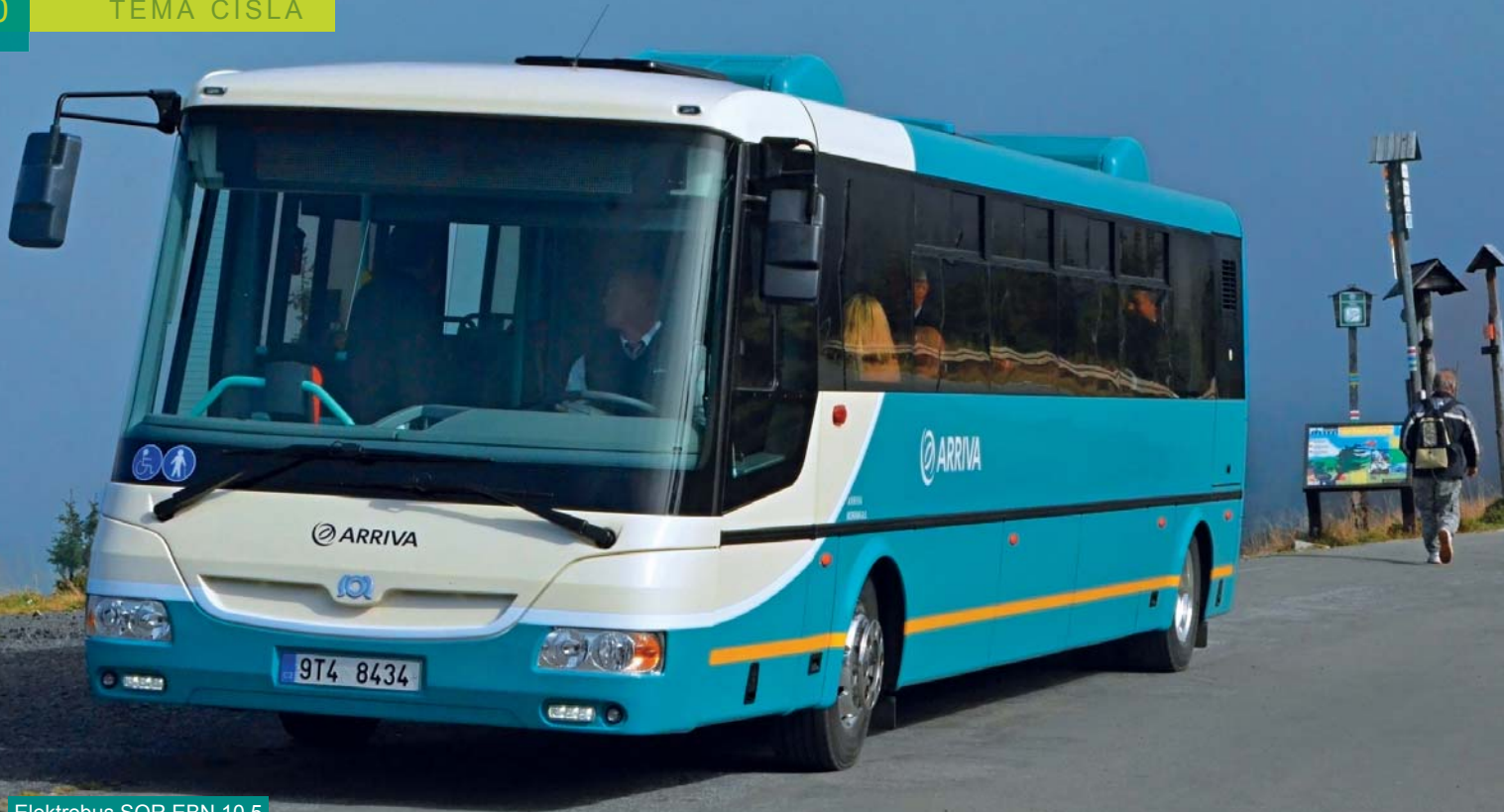
Elektrobus SOR EBN 10,5