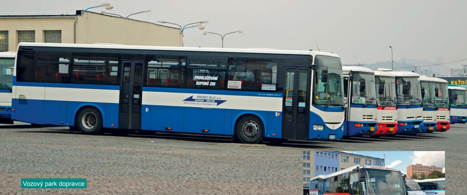
Vozový park dopravce