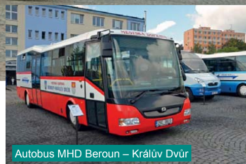
Autobus MHD Beroun – Králův Dvůr

Nejen cestující z oblasti jihozápadně od Prahy, zejména na území Berounska a Hořovicka, znají modrobílé autobusy společnosti PROBO BUS. Z Prahy se můžete autobusy tohoto dopravce svézt i na dálkových linkách směřujících převážně na jihozápad do Plzeňského nebo Jihočeského kraje včetně přímých spojů mířících až na Šumavu.