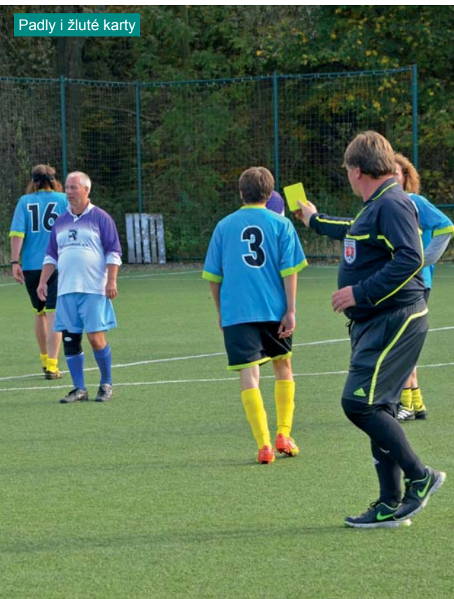
Padly i žluté karty