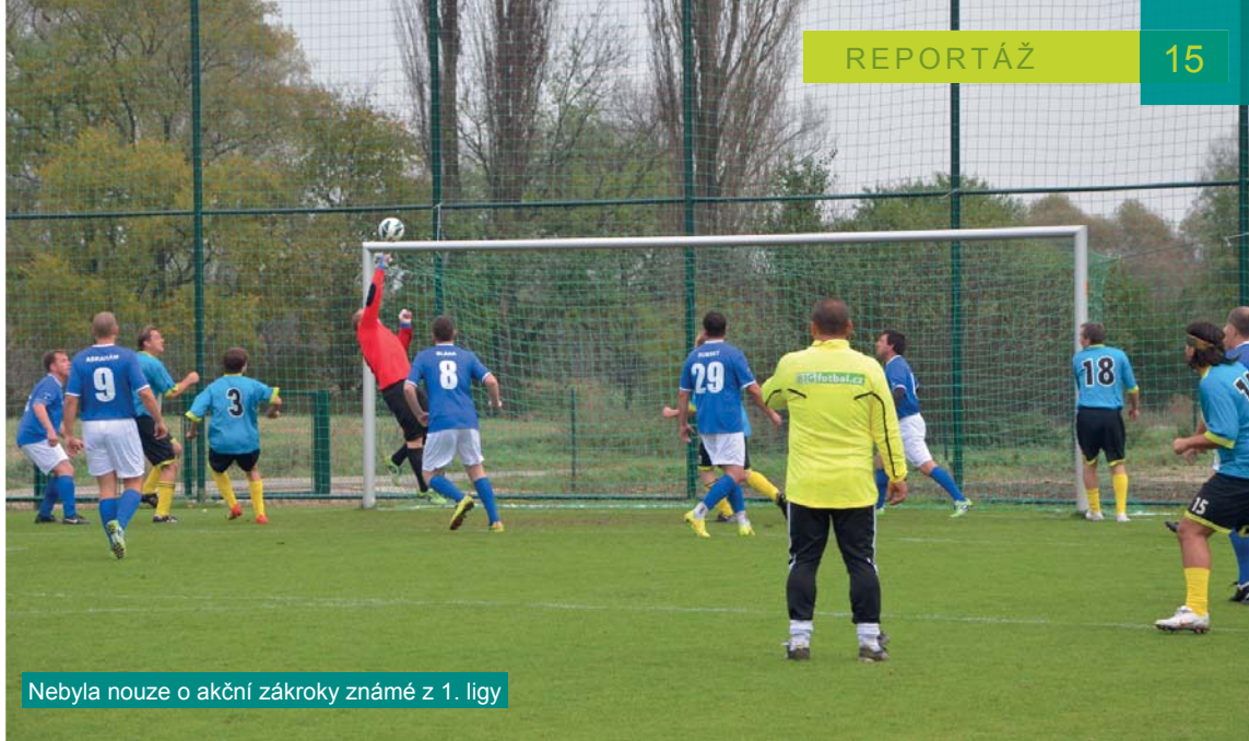
Nebyla nouze o akční zákroky známé z 1. ligy