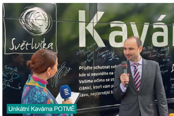
Unikátní Kavárna POTMĚ