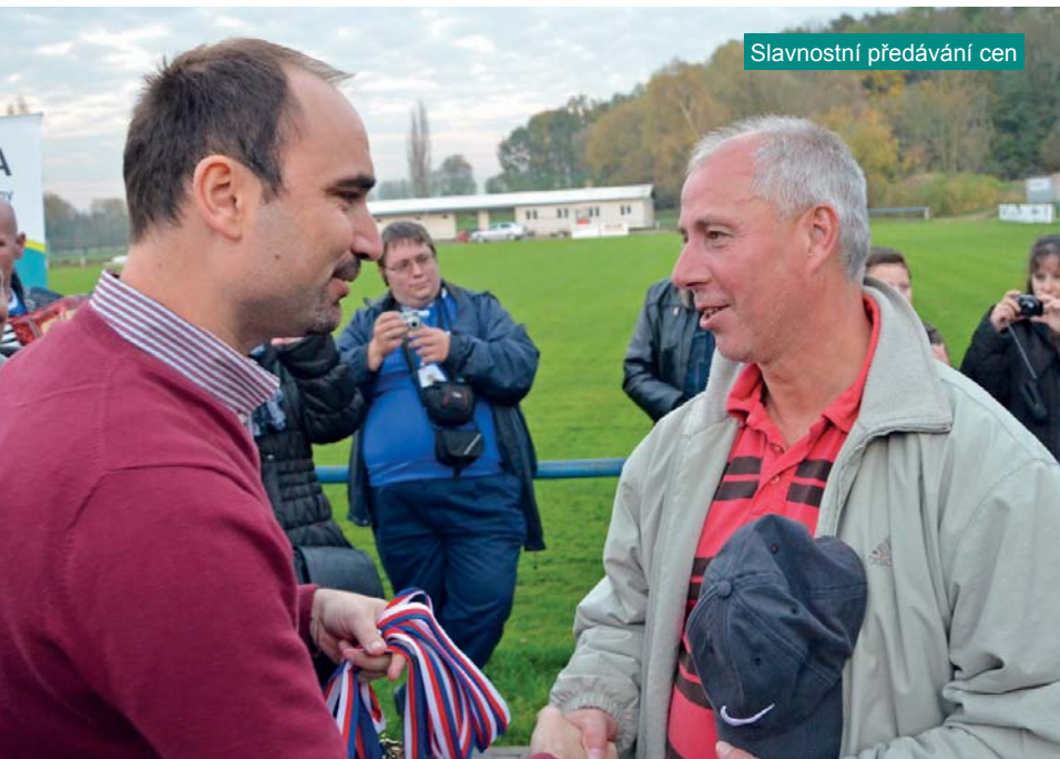
Slavnostní předávání cen