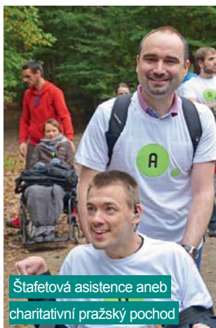
Štafetová asistence aneb charitativní pražský pochod

Chtěl bych všem kolegyním a kolegům popřát klidné vánoční svátky, aby si mohli odpočinout v kruhu rodiny nebo svých blízkých a načerpali dostatek sil, které budeme v roce 2015 potřebovat na realizaci všech zajímavých projektů, jež nás čekají. ■