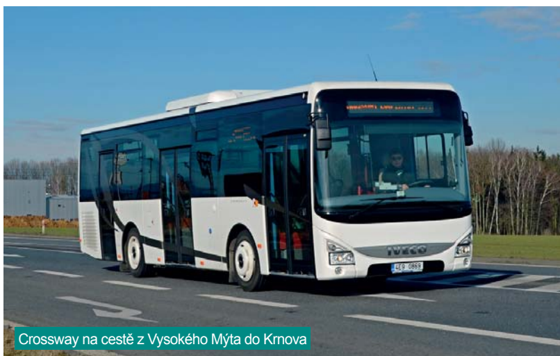
Crossway na cestě z Vysokého Mýta do Krnova

tak i mechanickou plošinou k usnadnění nástupu pohybově handicapovaných občanů nebo rodičů s kočárky. Obsaditelnost vozidla je 30 + 1 míst k sezení a 61 k stání. Kromě nových technologií došlo u nového Crosswaye ke změnám v designu vozidla včetně loga Iveco. Autobus je 10 845 mm dlouhý, 2 550 mm široký a 3 140 mm (s klimatizací 3 230 mm) vysoký. Vozidlo je vyráběno v závodě ve Vysokém Mýtě. ■