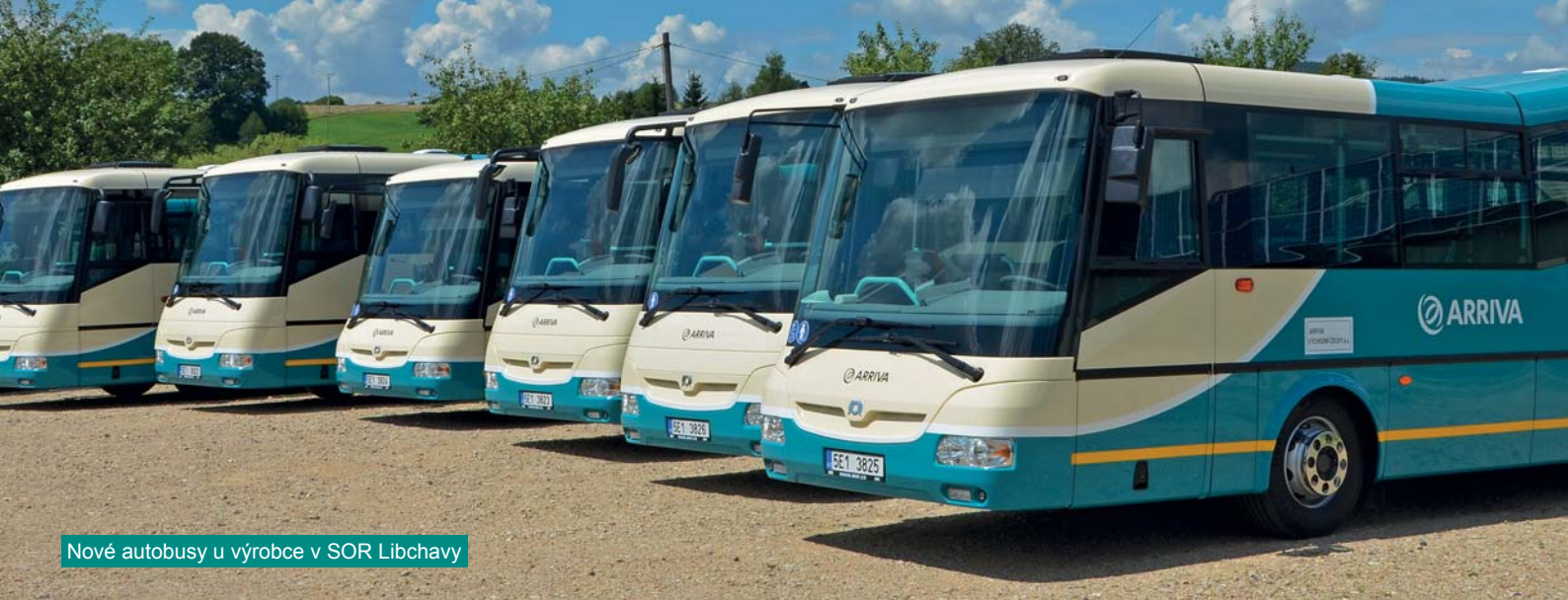
Nové autobusy u výrobce v SOR Libchavy