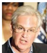
JAY NIXON guvernér státu Missouri