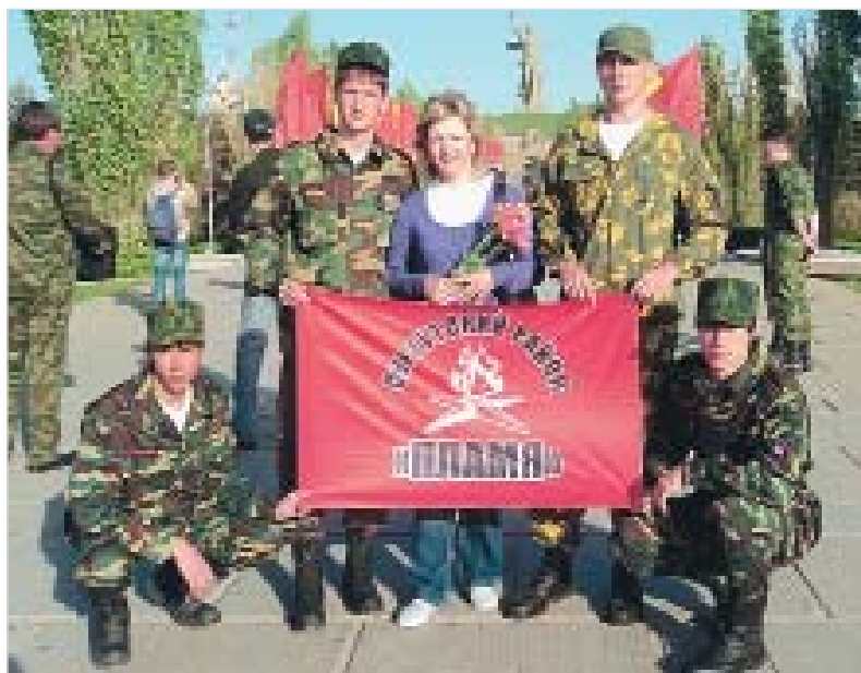
Ольга МИХАЙЛЕНКО