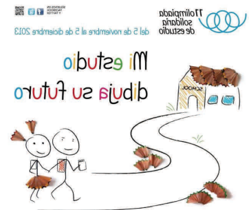
Campaña de sensibilización "Olimpiada Solidaria del Estudio" en colaboración con la ONG Cooperera y la BUC de la UC.

Esta semana os proponemos principalmente iniciativas de la propia Universidad (como la Olimpiada Solidaria del Estudio que ya os hemos dejado en primera página) pero sin olvidar otras actividades fuera de ella.