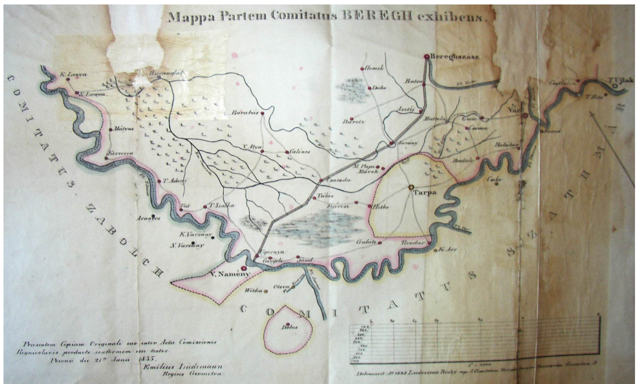
Bereg vármegye alföldi régiójának térképe 1835-ből 9

A Bereg megyei lakosságnak nagy gondot okozott a hegyekből gyorsan leérkező víz, amely az alsó beregi részekben lelassult. Itt már a szélesmedrű folyók a lassú folyás miatt szegeket képeztek, partokat szaggattak, mocsarakat tápláltak és szemben lévő vízpartokat töltöttek fel. Ennek következtében egyik-másik településnek, például az 1832–1836-os országgyűlés által Bereghez csatolt Tarpának, időről időre változtak a határai. Ebből adódóan Bereg megyének több konfliktusa volt a szomszédos megyékkel, főleg Szatmárral, mert a magasabban fekvő Bereg apró gátjaival át tudta terelni a Tisza vízáradásait Szatmár falvaira.