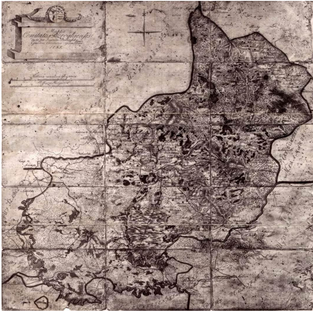
Bereg vármegye 1785-ben 7