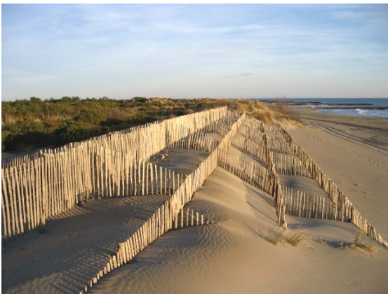
Des systèmes sont mis en place pour stabiliser les dunes (janvier 2005).