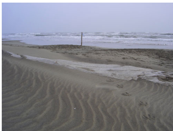
La plage de l'Espiguette en hiver (janvier 2006).