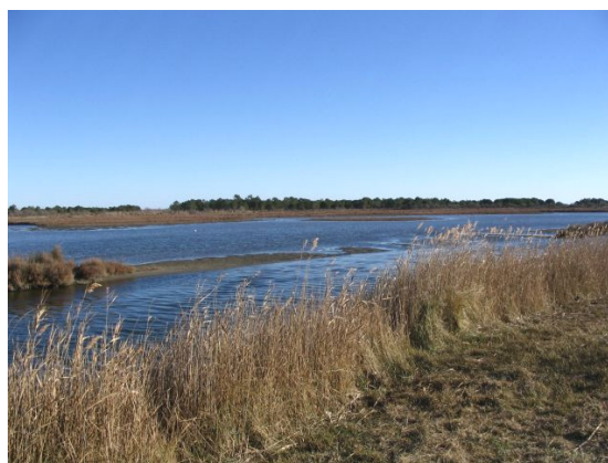
En arrière des dunes, le site de l'Espiguette présente des zones humides et des bois de pins du (janvier 2005).