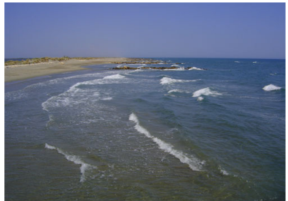
Système d'épis en batterie pour freiner le recul du trait de côte (juin 2006).