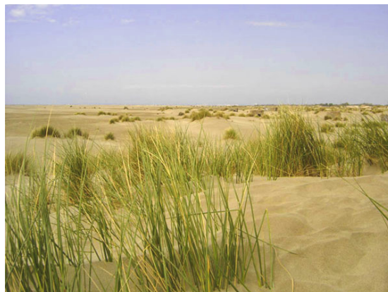
En amont de la plage de l'Espiguette, le système dunaire est colonisé par l'Oyat (mai 2006).