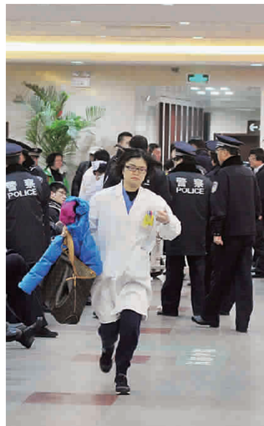
上海市第一人民医院医护人员一到医院,边跑边换上工作服即刻投入抢救