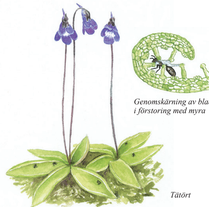
Genomskärning av blad i förstoring med myra

Förr i tiden användes tätörtens blad till beredning av den sega långmjölken eller tätmjölken. Den verksamma komponenten i växten är en speciell mjölksyrabakterie som även finns i kalvens löpmage. På fuktig torvmark hittar man silesår som också den fångar och "smälter" insekter.