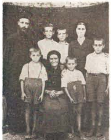
Μια ιδανική φαμελιά, της ώρας εκείνης εποχής.

Και πάρα κάτω θα έβρεπε να γράφει ότι μοιόαζα με σκιαγμένο άνρι, ξεκομμένο από το κοπάδι και χαμένο μέσα σε άγρια ζούγκλα και τριγυρισμένο από τα πιο φοβερά και αιμόδοξα θείρια. Μήπως είναι υπερβολή; 'Οχι! 'Οχι!