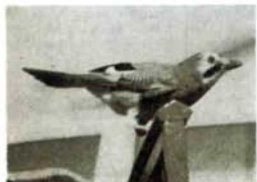
Που θα μου πάει ο μπαρμπα-Βάιος, δεν θα διγεί; Εγώ πάντως θα τον περιμένω εδώ, σκαρφαλωμένος στην κισσα καθώς έχει στηθεί στην καγκελάριε για να τον δει και να τον ακολουθήσει όπου κι αν πάει...