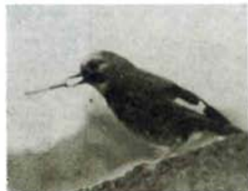
Μόνο γ' αυτό μπαρμπα - Βάιο θα καννίζεις; Θέλω κι' εγώ! σκαρφαλωμένος στην κισσα και του άρπαζε το τουγάρι για να πάει με την πτυχία της να το... καννίσει στη στέγη της αποθήκης...