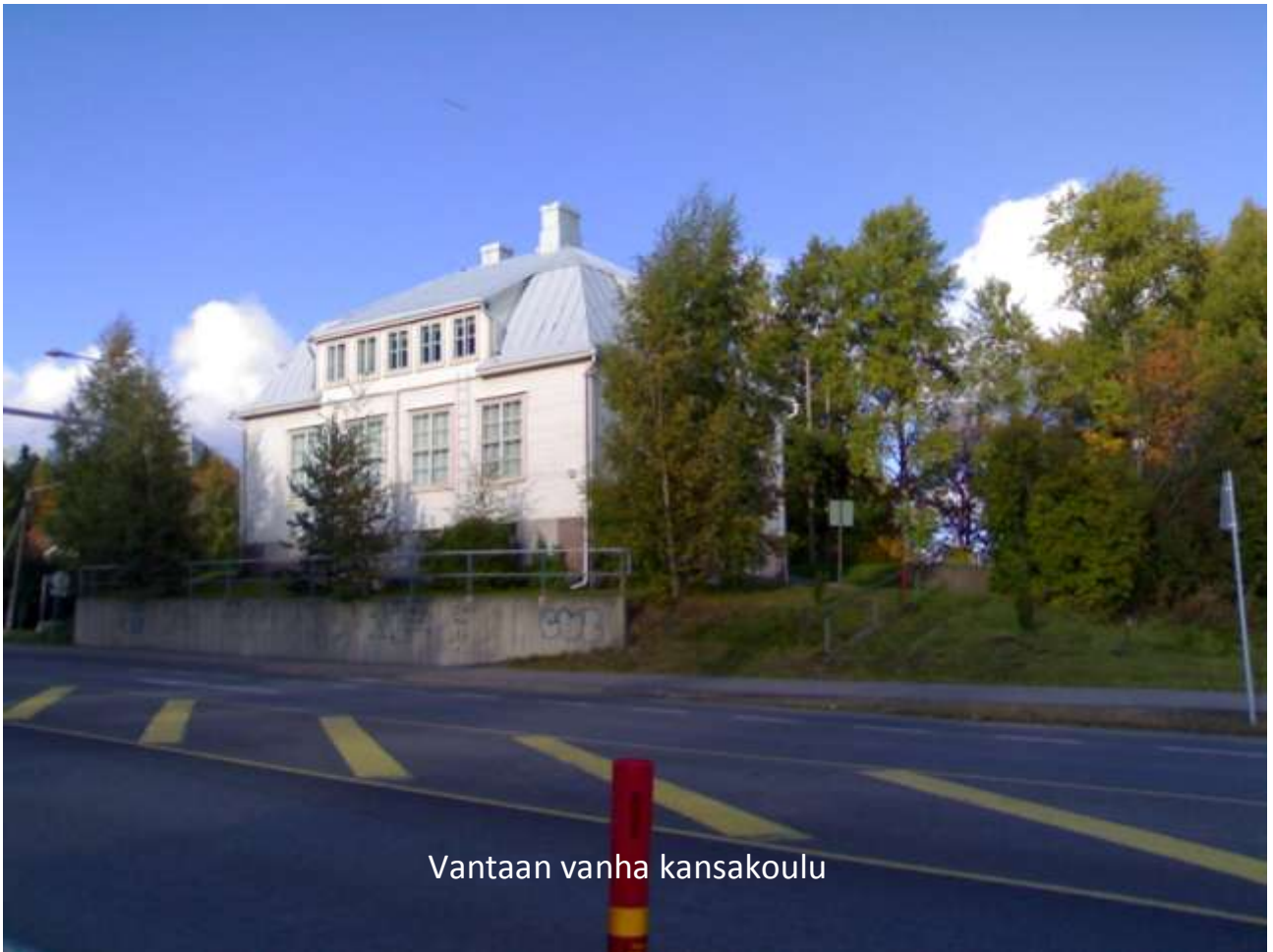
Vantaan vanha kansakoulu

Oma koulu valmistui kauniille kallioiselle koivikkomäelle syksyksi 1961.