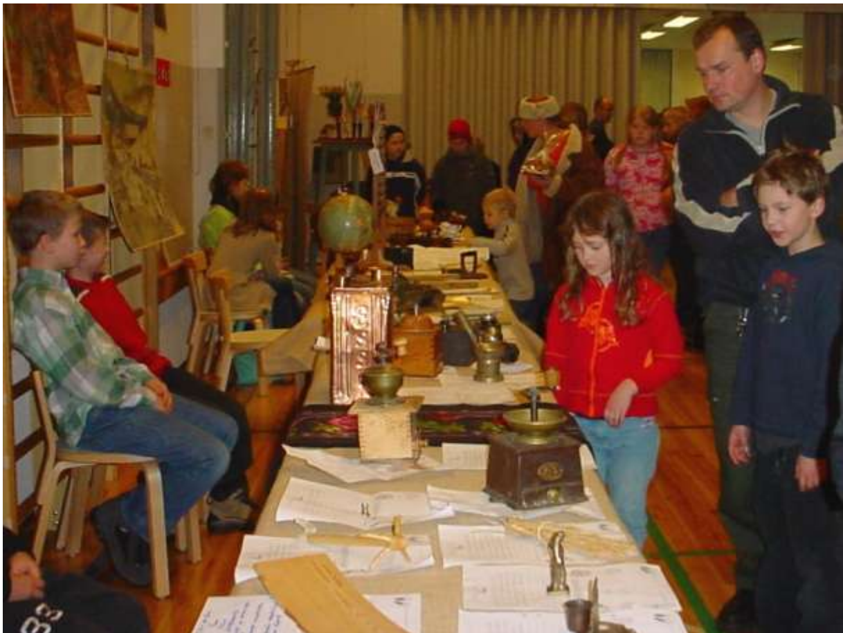
Vanhon tavaroiden näyttely