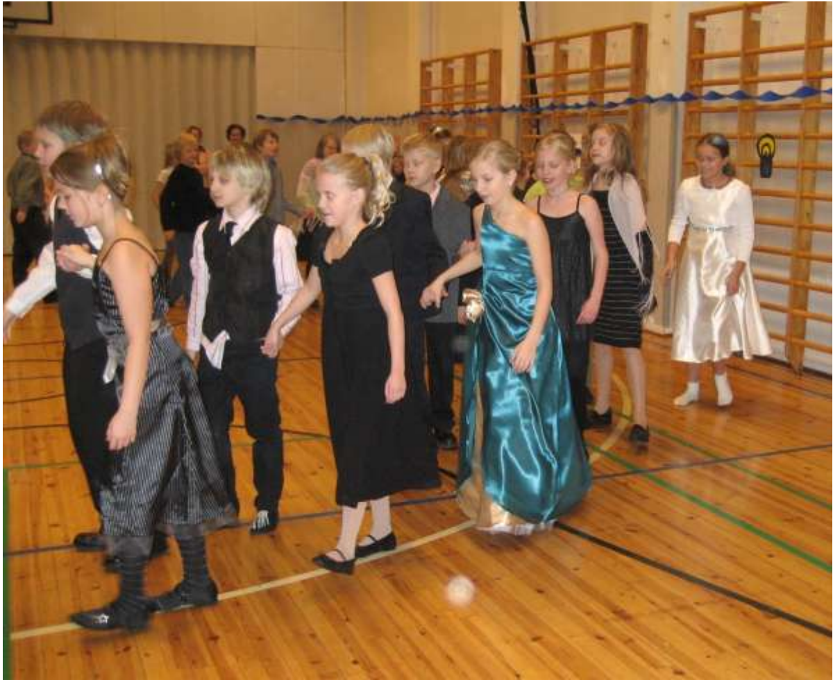
Viimeistään vappuna irrotellaan.