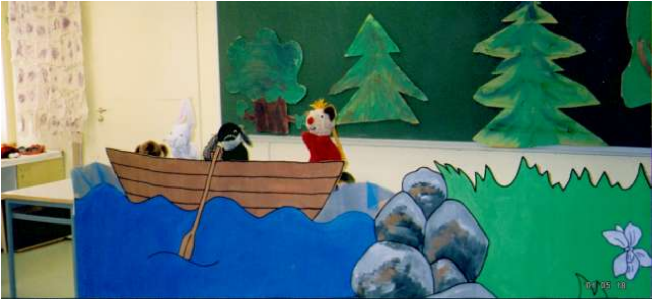
Nukketeatteria 2001 (Vantaa 650 v.)