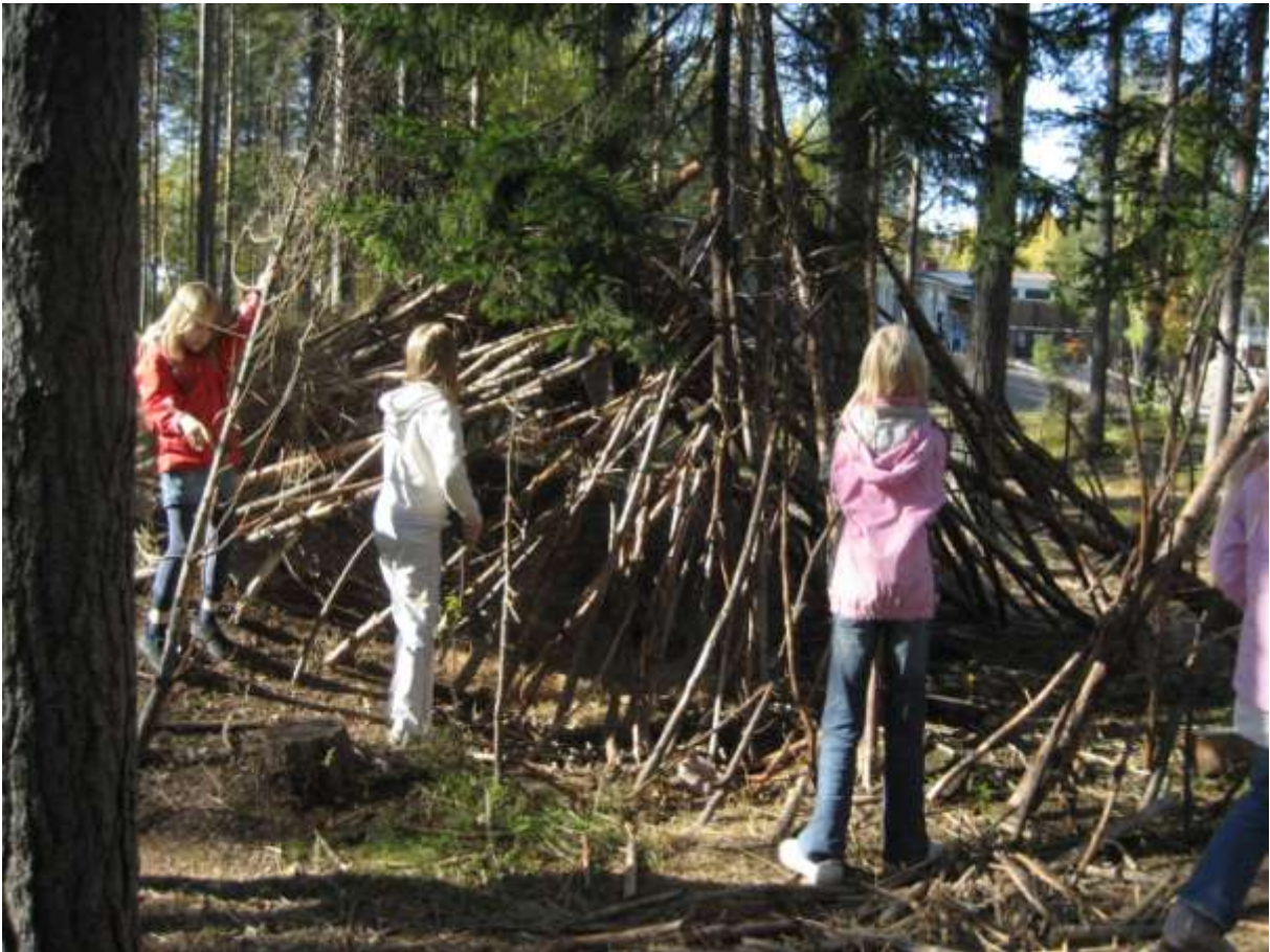
3B:n majanrakennusta 2008