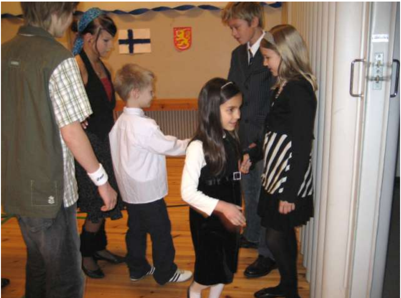
Itsenäisyypäivän juhlat 2007