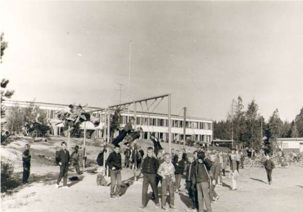
Koulun pihalla leikitään...