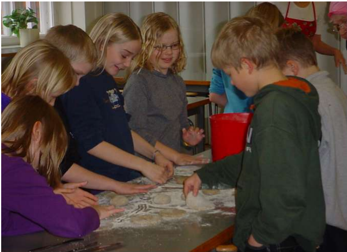
Leivän leivontaa 2000-luvun alussa