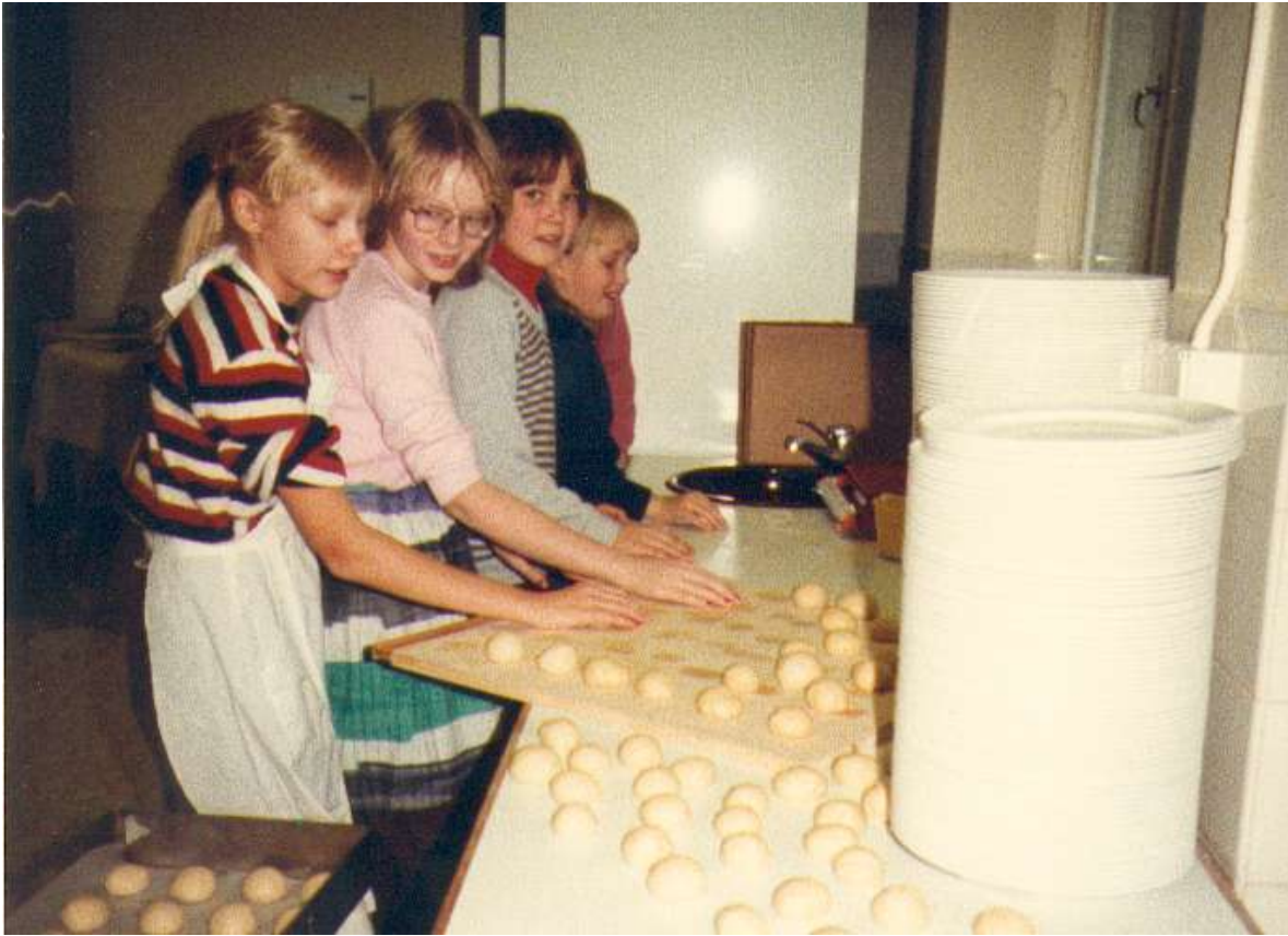
Kuvassa leivotaan pullia, koska vieraaksi on tulossa silloinen opetusministeri Kalevi Kivistö, 1980-luvulla.