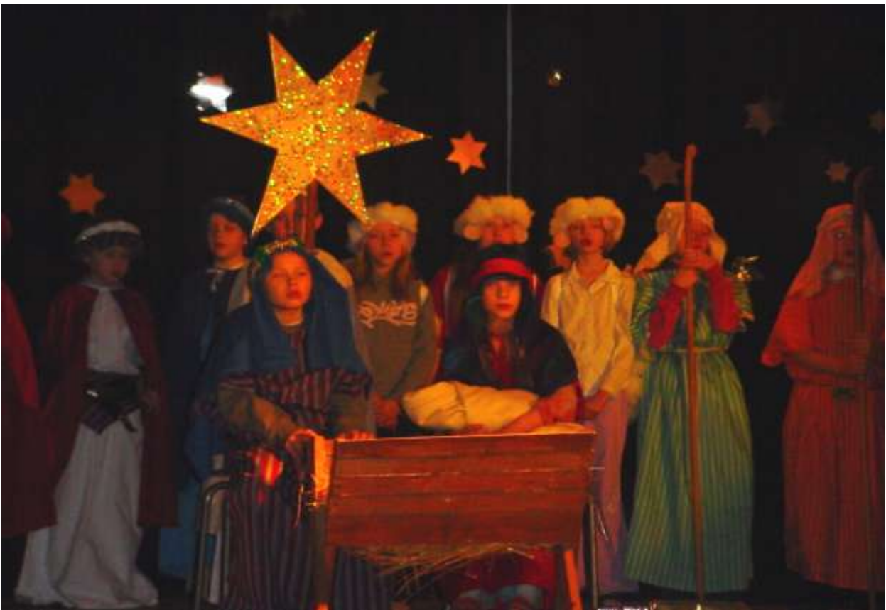
Joulukuvaelma on kuulunut miltei jokaiseen joulujuhlaan, kuva 2000-luvun alusta.