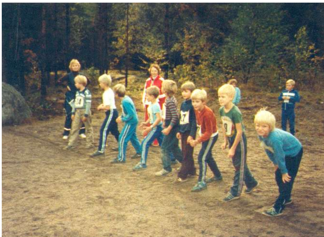
Poikien juoksusarja lähtöviivalla.

Koulun kenttä on ahkerassa käytössä niin talvella kuin kesälläkin.