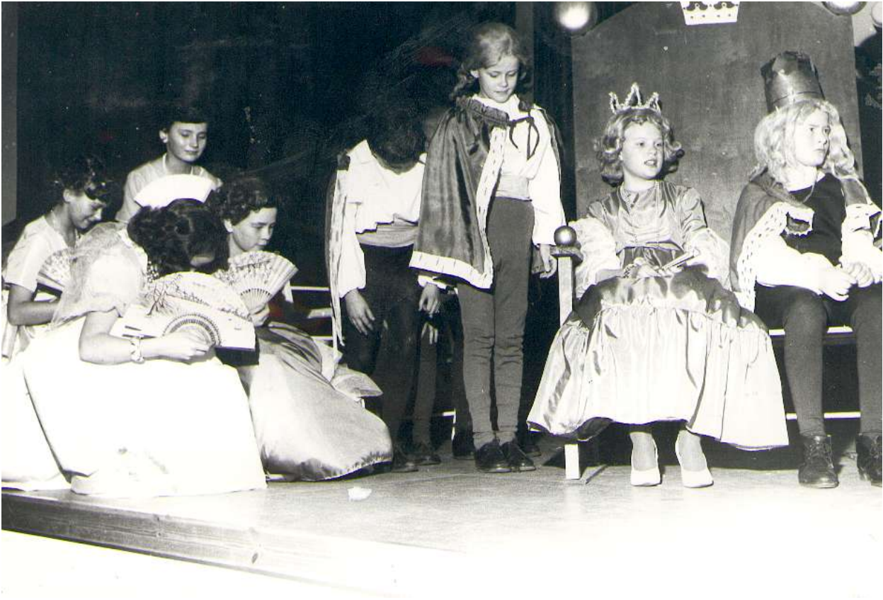
Erilaiset juhlat ovat tärkeä osa koulunkäyntiä: Joulunäytelmä Adalmiinan Helmi 1963.