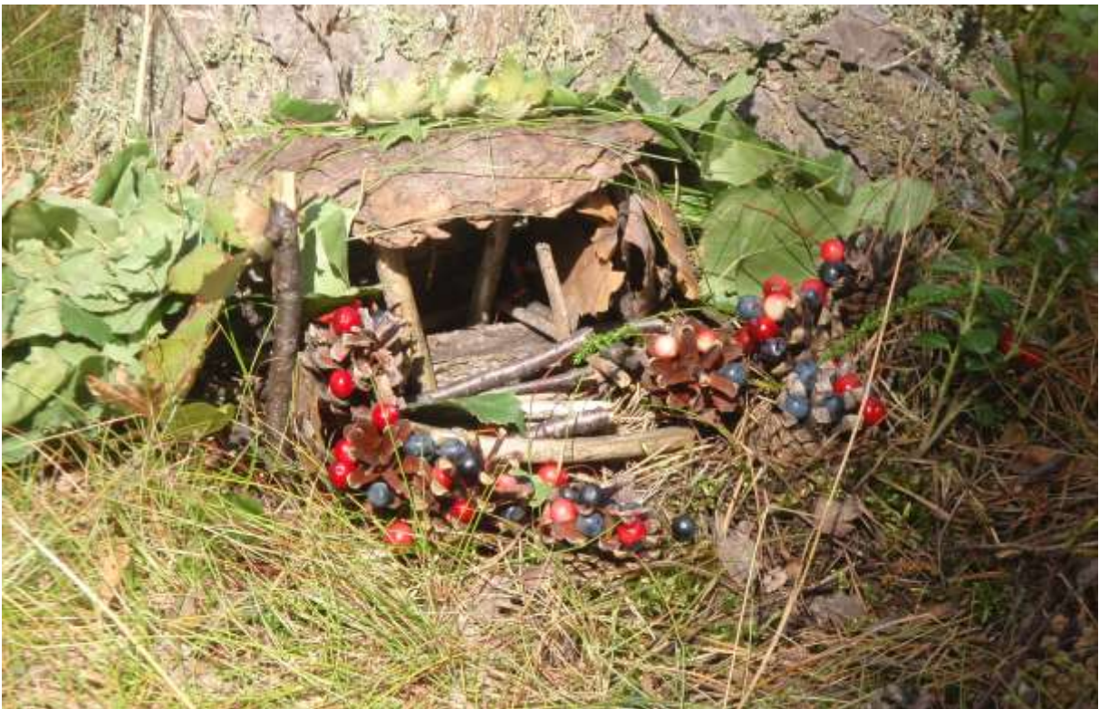
Tokaluokkien luontotaidetta syksyllä 2012