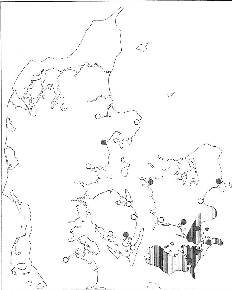
Kort over deltagelsen i fiskeriet ved Skanør og Falsterbo. – Udfyldt cirkel = købstæder med egne fiskelejer ved Skanør eller Falsterbo. Ring = andre købstæder, som har deltaget i fiskeriet. Skraveret område = de egne, hvorfra hovedparten af de deltagende bønder kom.