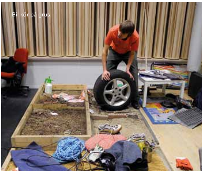
Bil kör på grus.