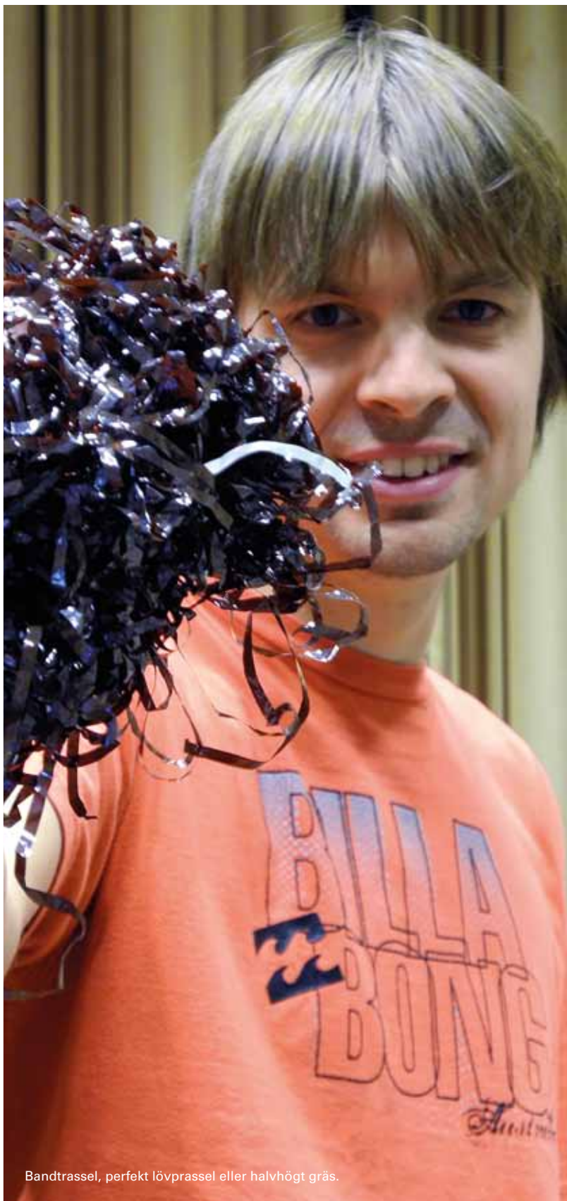
Bandtrassel, perfekt lövprassel eller halvhögt gräs.

För dem som gillar att sitta kvar i soffan när Hollywoodfilmen är slut och försöka läsa alla credits som rullar fram så har det kanske inte undgått er att det rätt ofta står "Foley artists" en bit ner med några namn på artister man aldrig har hört talas om. PÅ svenska kallas det i allmänhet för Tramp, även om det inte bara är ett regelrätt tramp ljud alltid. Så vad är detta Foley för något? Hur går det till?