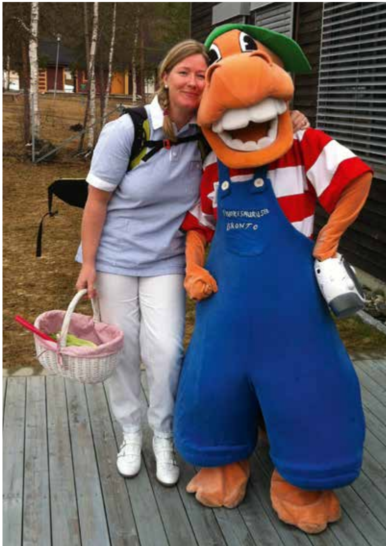
◀ Bronto og Renate klar til nytt besøk i barnehage.