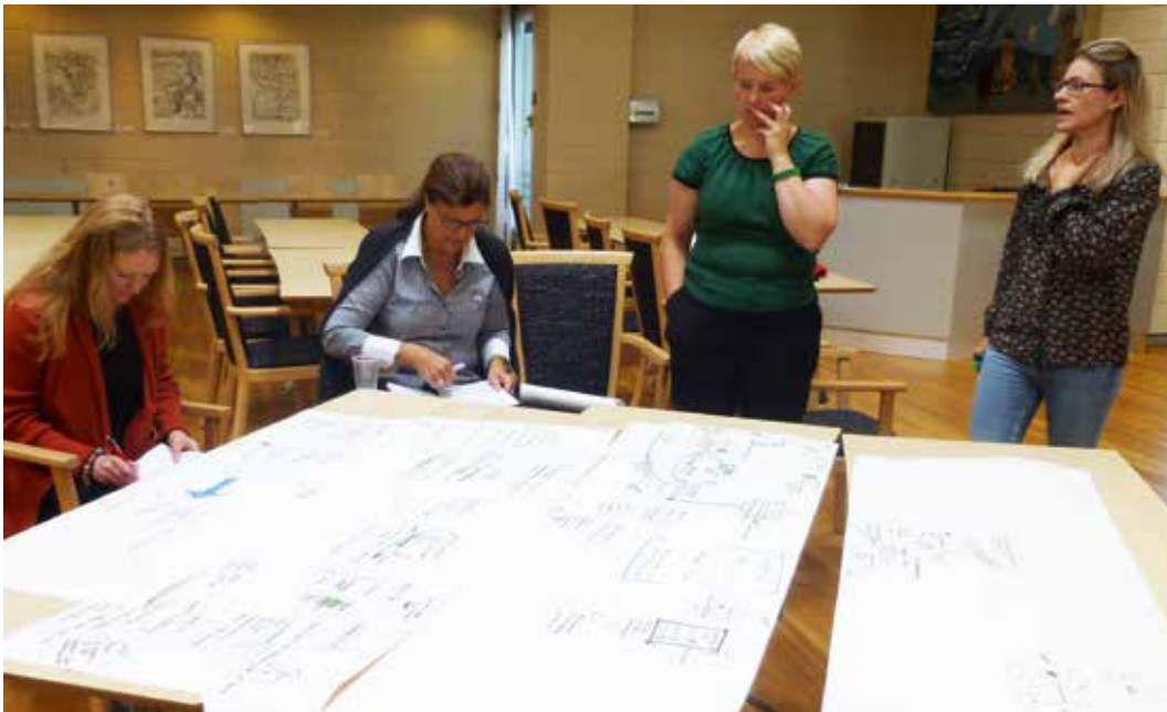
▲ Engasjementet var på topp hele tiden.