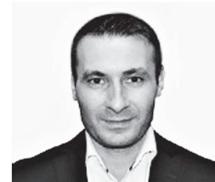
Р.Т. ГАЗЗАЕВ Советник Президента