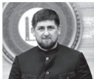
Р.А. КАДЫРОВ Глава ЧР, Почетный Президент РФК «Терек»