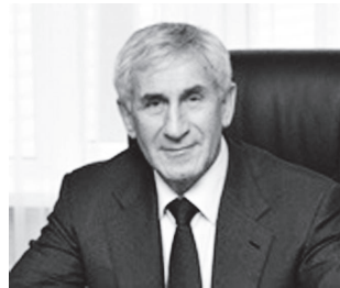
Х.М. АЛХАНОВ Вице-президент