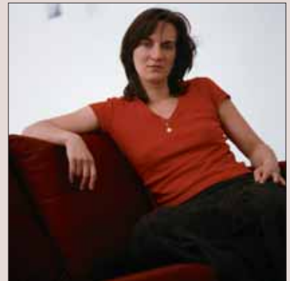
Auch die vielfach ausgezeichnete Schriftstellerin, Drehbuchautorin und Übersetzerin Therézia Mora liest am Neusiedlersee.