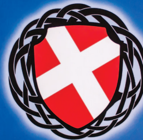
Danskernes Parti — Principprogram

Den trykte udgave af Danskernes Partis principprogram fra 2012.