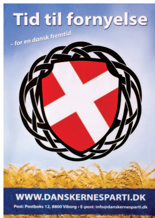
Danskernes Partis logo på en af partiets flyere.