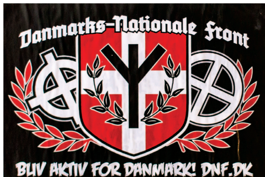
Klistermærke fra Danmarks Nationale Front. I midten ses organisationens logo med livsrunen, der også bruges af Danskernes Parti, og til højre et solhjul.

» Dette er det nye logo. Dannebrog svøbt i krims krams. Bemærk vinkelen, vi tror der er et hagekors gemt bagved...”