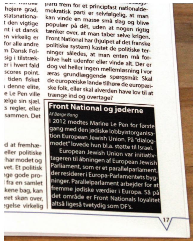
Stuerent samlingsparti: trods den påståede ideologiske holdningsændring væk fra nazismen, har Danskernes Parti åbenbart stadig en interesse i jøder og jødiske konspirationer. Her et eksempel fra medlemsbladet Identitet..