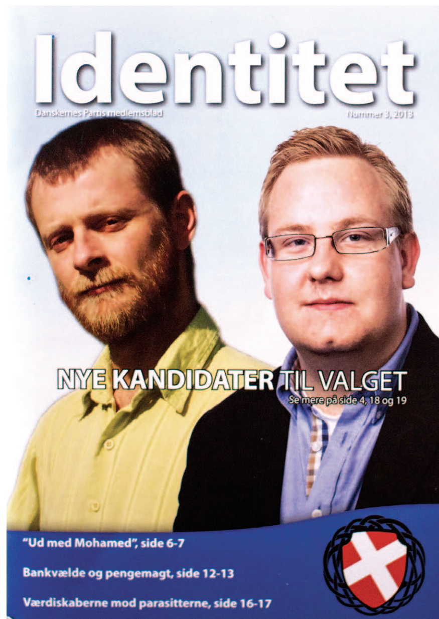
Danskernes Partis interne medlemsblad Identitet .