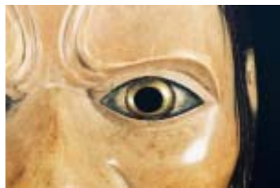
きんぞく わ 金属 た の輪をはめている。