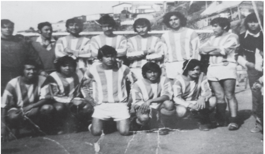
Cancha María Eisler