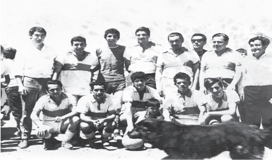
Un Placerino infaltable en las canchas, el perro o quiltro placerino Club Hugo Radovich de la comunidad Huckle.