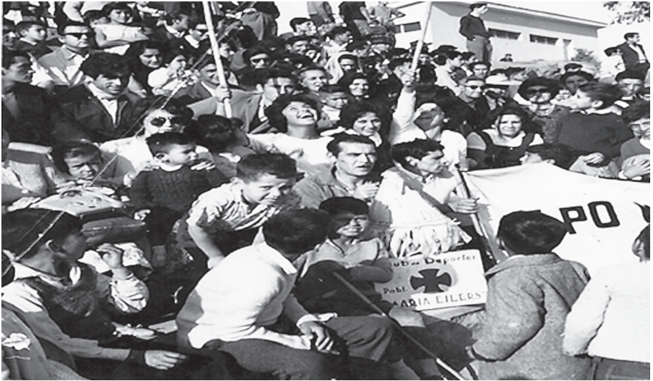
Barra del club María Eisler en cancha de Miraflores apoyando a sus jugadores

Al comenzar la década del 60' las dos almas del fútbol en María Eisler se unieron, no queda claro en las entrevistas como ocurrió la fusión, pero si registramos algunos hechos acaecidos: la Asociación de Deportes Los Placeres queda sin las canchas de Viña del Mar, se detiene la competencia y sus clubes asociados buscan nuevos rumbos, los clubes de Placeres se registran en la nueva Liga de Foot-Ball Placeres Alto que juega en canchas de la actual Villa Berlín. Este periodo además, coincide con el ingreso y empuje de nuevos dirigentes al club: