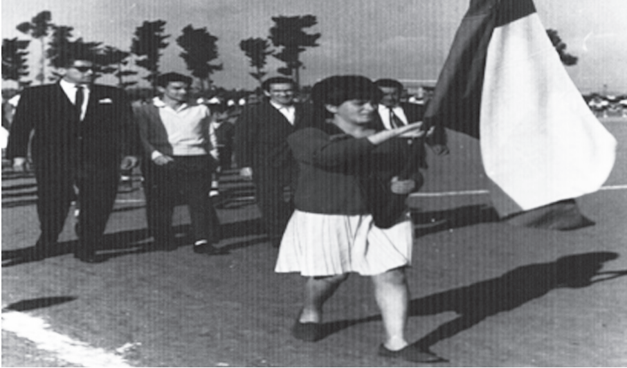
Desfile de delegaciones en el inicio de la competencia, desfila club Juventud Independiente 1961, 'Cancha el Bosque', situada en el actual barrio Villa Berlín.

Hacia 1962, una vez más los clubes se quedaron si cancha. Los dirigentes nuevamente se dieron la tarea a buscar un terreno adecuado, hallándolo en los límites del cerro. Otra vez el esfuerzo solidario y la tenacidad para ganarle a la geografía, a la falta de transporte, a la incomodidad y continuar con la Asociación y con el fútbol amateur en el cerro. Fue, y, hasta unos años atrás, seguía siendo habitual el trabajo voluntario de dirigentes y jugadores para la mantención de las canchas del cerro: hacer zanjas, rellenar, emparejar, evacuar aguas, sacar maleza, espinos y piedras.