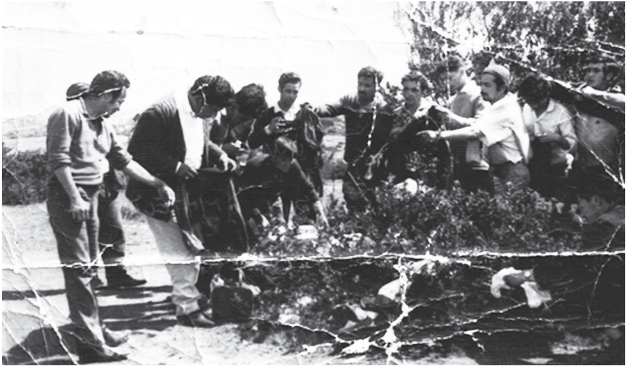
Camarín litre o boldo: jugadores del club deportivo Poderoso, cancha de Placeres Alto Década del '60.

“...después de la Villa Berlín fuimos a una cancha que quedaba más arriba que la población El Progreso, camino a Santiago. Eso era un puro peladero, no tenía camarines, no tenía agua, no había nada y llegábamos a patita no más, no llegaban las micros. Nos cambiábamos ropa entremedio de las matas, estaban los camarines boldo y litre. La cancha estaba llena de piedras y ramas esos de espinos y la íbamos limpiando mientras íbamos jugando, esa cancha era disporeja, el arquero del arco de abajo - pal' lado de huaso chaguino-, no veía a los jugadores que estaban en el otro arco, solo los veía cuando se le