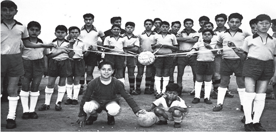
División juvenil del club María Eisler en desfile de las delegaciones en inauguración del campeonato del año 1974, cancha María Eisler

Y luego de tener rellena la quebrada, había que equipar la cancha, surgiendo nuevos desafíos: