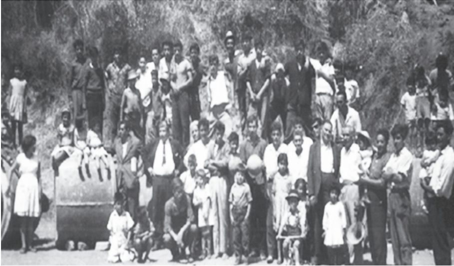
Vecinos de la población María Eisler, en trabajos voluntarios para instalar los tubos de evacuación de aguas, sistema que atraviesa la quebrada que acogería la futura cancha María Eisler. Diario La Unión 1958.