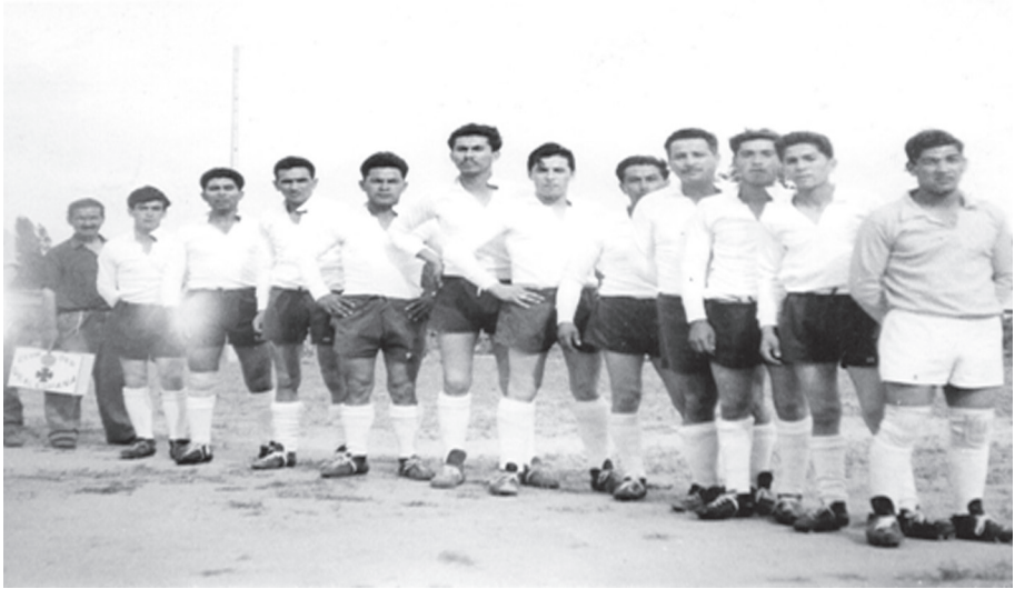
Segunda división del club Real España en Limache

El club debe su nombre a la fecha elegida para su fundación, el 12 de octubre ‘día de la raza’ y entonces en honor a España asumen el nombre de Real España, asumiendo los colores de la bandera española.