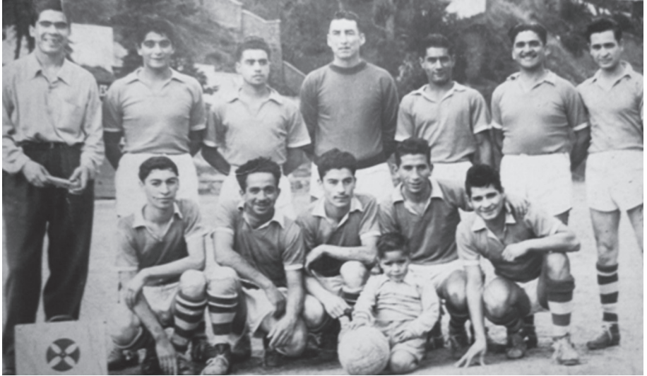
Estadio 'el Sauce', club deportivo Bartolomé Vivar.