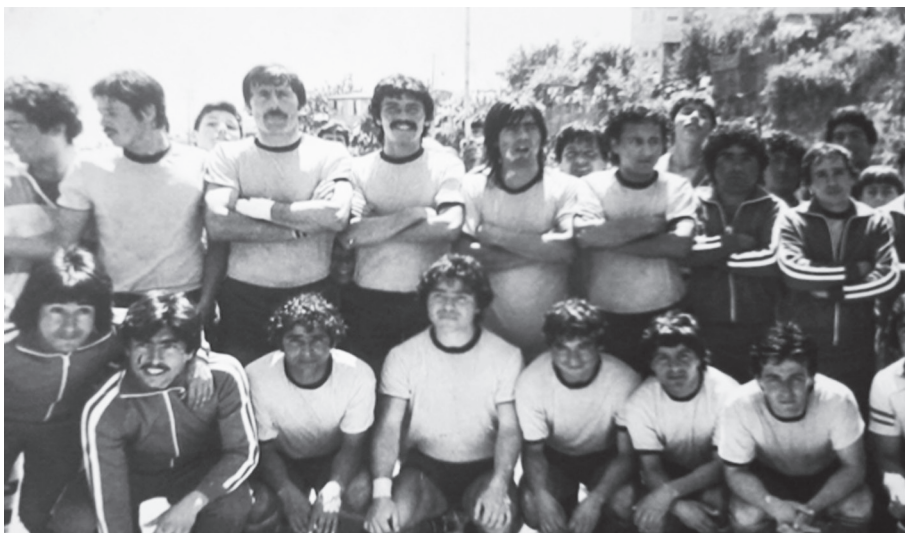
Selección Los Placeres 1983