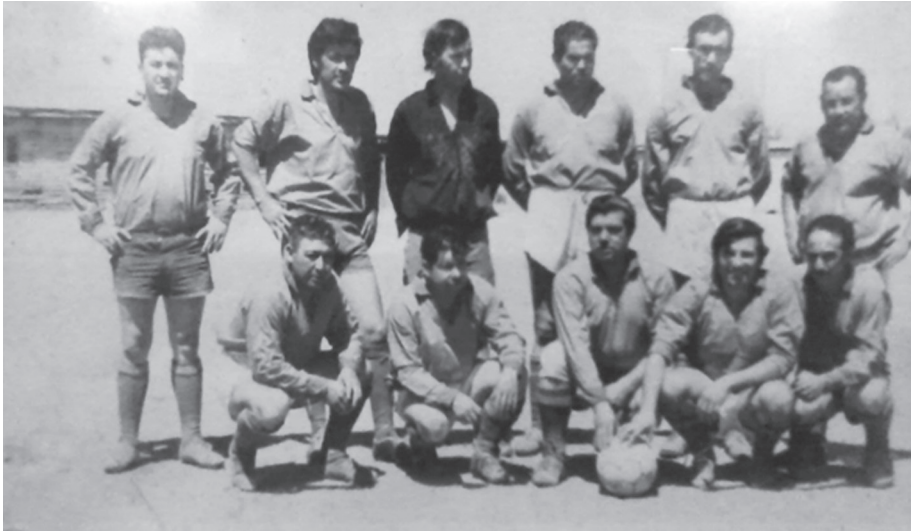
Equipo El Progreso década del '60.