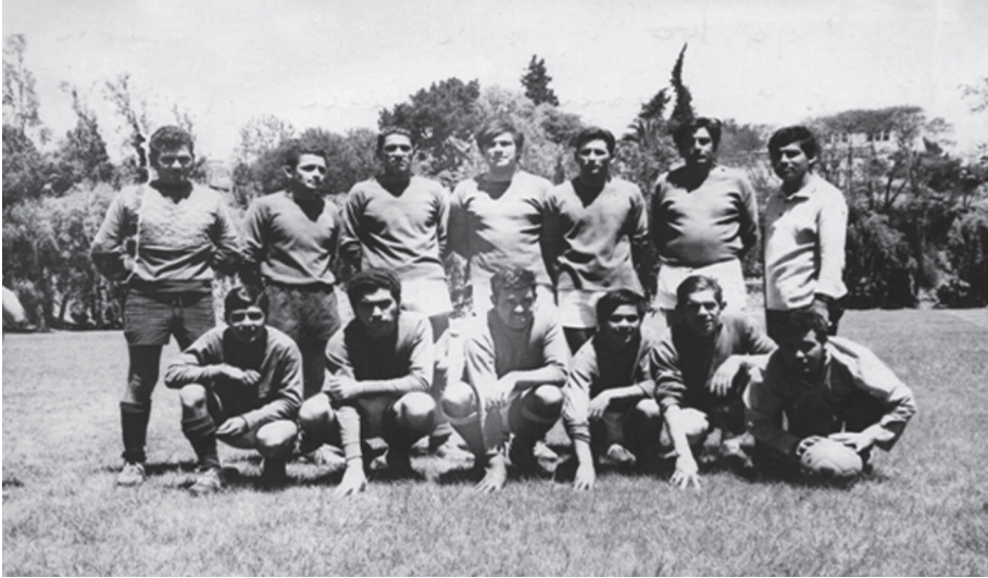
Tercera División del club Poderoso campeón torneo de 1976 final jugada en cancha de la Universidad Santa María