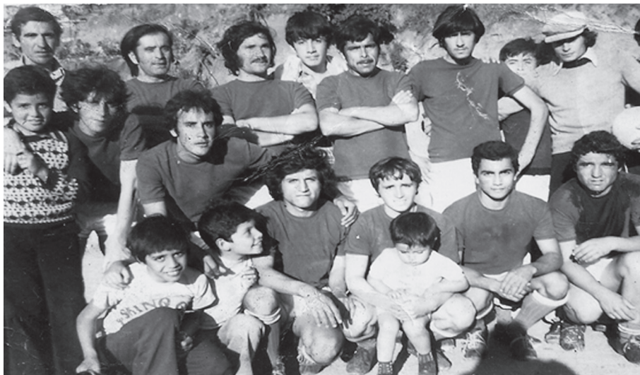
Primera División del club Cincel en la década de los '80 cancha María Eisler