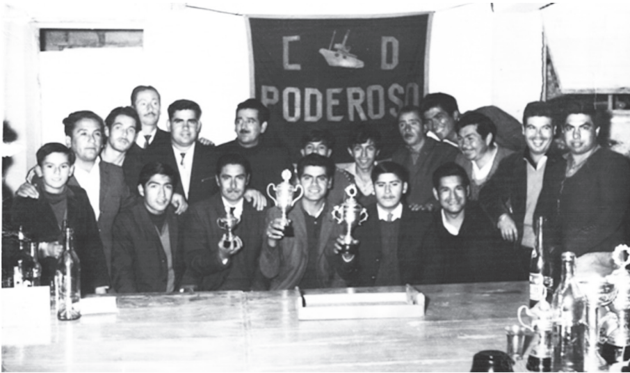
Dirigentes y jugadores del club deportivo Poderoso Fiesta de Aniversario década del '70