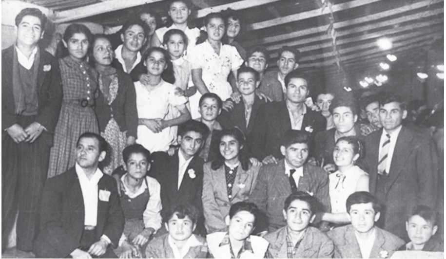
Jugadores, dirigentes y la hinchada del club María Eisler, en ceremonia de entrega de premios en la 'Quinta Araya' 1953

Esta Asociación de Deportes Los Placeres realizó por algún tiempo actividades en el estadio 'El Sauce', hasta que este fue vendido por los ferroviarios; de ahí los dirigentes lograron que el campeonato continuara jugándose en la cancha de la Armada en recta Las Salinas y en la cancha de la Universidad Santa María.