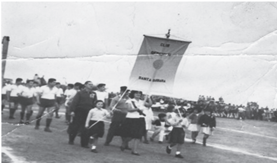
Inauguración de Torneo en la Liga Placeres Alto. Los clubes deportivos desfilaban con sus jugadores y dirigentes. Presentación del club Santa Bárbara 'Cancha el Bosque' 1958, actual barrio Villa Berlín.