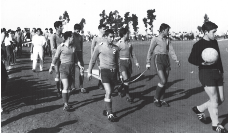
Fotografía de 1961 canchas del actual barrio Villa Berlín. Al inicio de cada competencia cada club se presentaba con sus delegaciones de jugadores, dirigentes, rama femenina y estandarte del club o emblema Nacional. Se aprecia la masiva convocatoria de la familia placerina, en la cancha conocida como 'El Bosque'. Desfila club deportivo Juventud Independiente