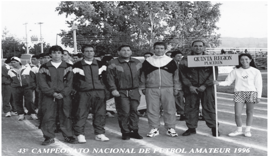
Selección Placeres de Vice Campeones Campeonato Nacional de Fútbol Amateur 1996 Rengo