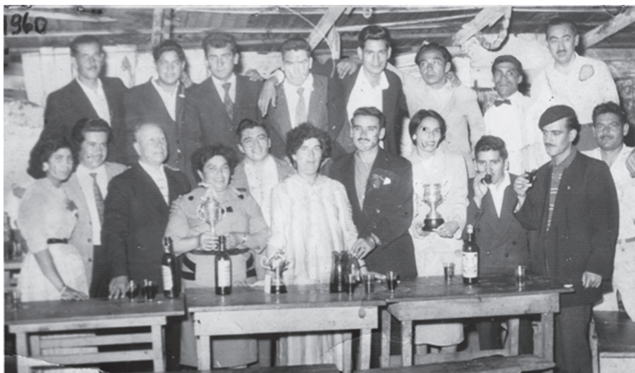
Premiación en Quinta María club Deportivo Pedro Vergara. Febrero de 1960