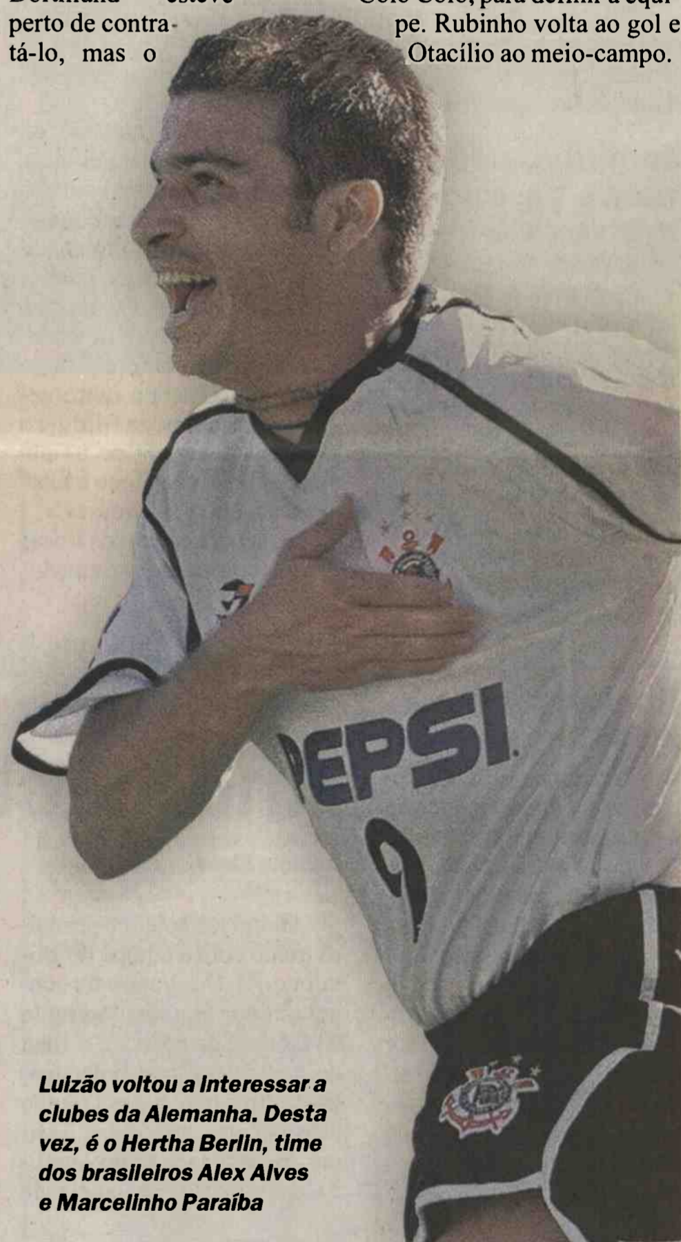
Luizão voltou a interessar a clubes da Alemanha. Desta vez, é o Hertha Berlin, time dos brasileiros Alex Alves e Marcelinho Paraíba

Pela manhã, Luxa estava no Rio em outra audiência, referente ao processo de sonegação fiscal, e, por isso, não pôde vir para São Paulo em tempo.