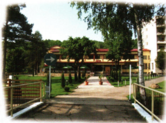
Pensiunea Casa cu Tei