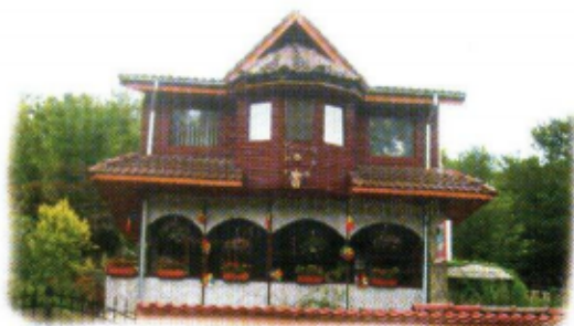
Pensiunea Casa Buzoiană