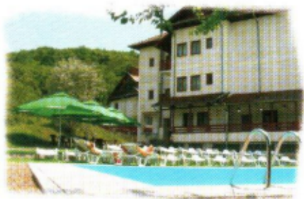
Pensiunea Vița de Vie