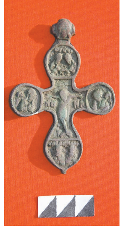
Мідяний хрест XVII ст., знайдений біля зруйнованого місця розташування садибної церкви.

В Україні за довідками про розкопки Батурина, будь-ласка,