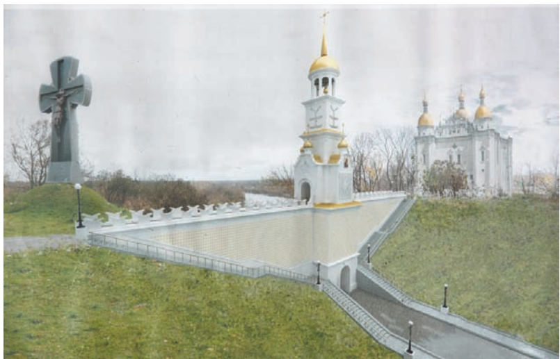
Нездійснений амбітний проєкт побудови меморіальних каплиці та собору, присвячених 300-річчю Батуринської трагедії 1708 р., біля цитаделі. Комп'ютерна композиція 2008 р. Фонди Батуринського заповідника.

готувалась встановити біля батуринського Археологічного музею. Археологи відкрили там залишки жителів і зернових ям князівської й козацької діб та шар згорілої забудови, що лишився від великої пожежі міста у 1708 р. Сумно, що теперішні державні фінансові скорочення зупинили спорудження в Батурині цього монумента, а також цікавого бронзового пам'ятника козакам як оборонцям віри та української Церкви.