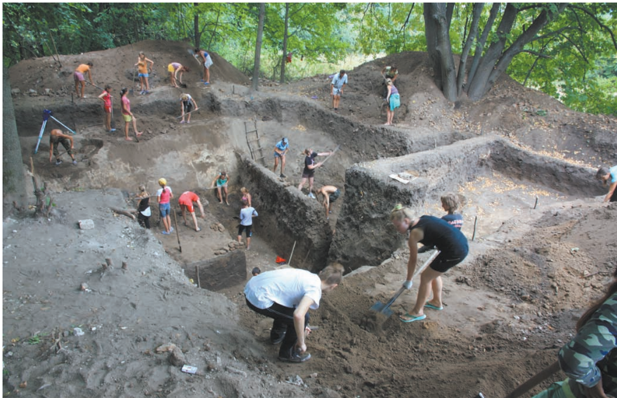
Розкопки котловану зрубного житла («покоєва хата») Мазепиною садиби на Гончарівці у 2010 р.