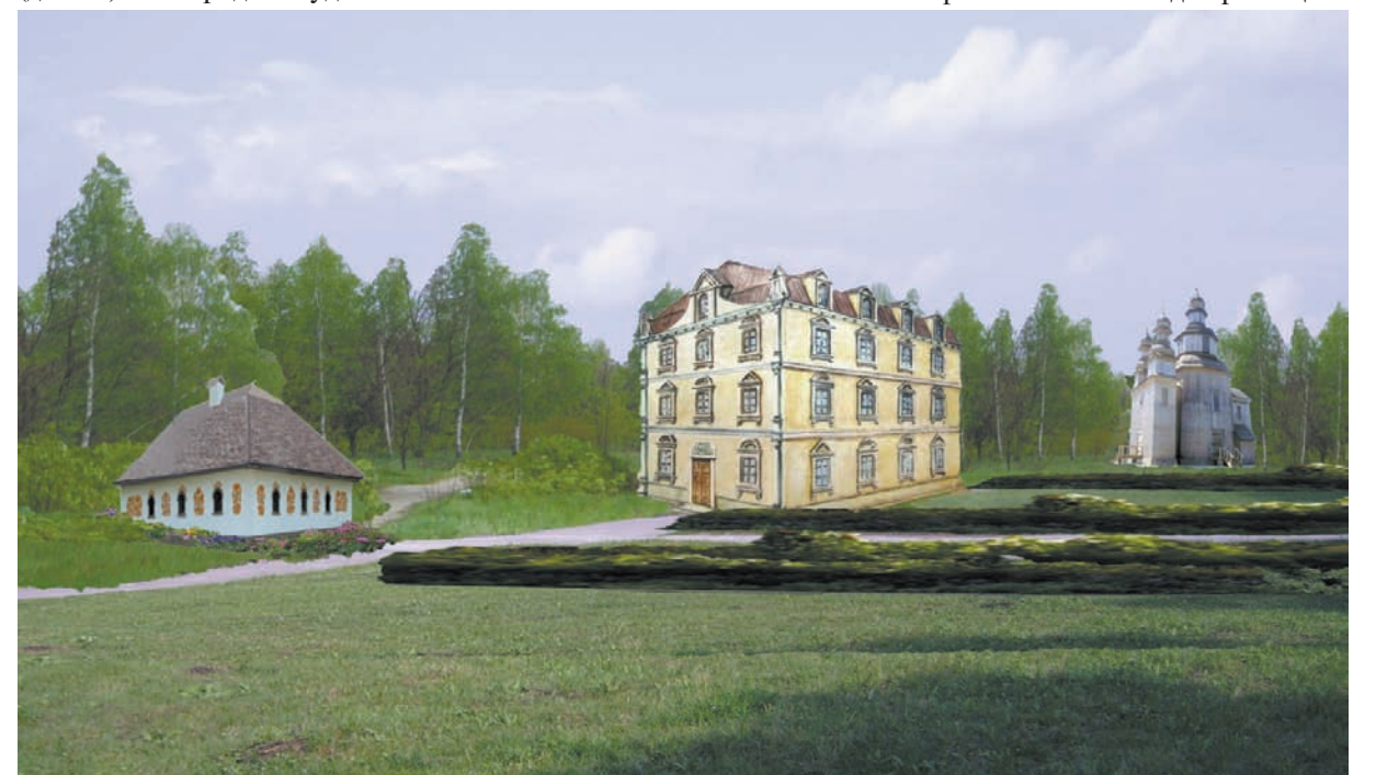
Мурований палац та відомі сусідні дерев'яні споруди Мазепиного подвір'я на Гончарівці. Гіпотетична реконструкція В. Мезенцева, малюнок і комп'ютерний дизайн С. Дмитрієнка, 2011.

13 листопада 2010 р. заповідник організував відзначення річниці Батуринської трагедії 1708 р. з церемонією перепоховання решток загиблих, які ми знайшли в ході розкопок кладовища Троїцького собору на фортеці у 2009