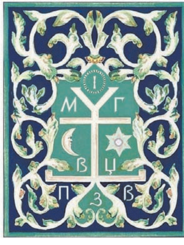
Керамічна глазурована плита з гербом і монограмою Мазепи з опорядження фасад його гончарівського палацу. Мальована реконструкція В. Мезенцева та С. Дмитрієнка, 2010 р.

тавці «Україна-Швеція», влаштовані 2008 р. у Києві, демонструвалось кілька металевих ар-