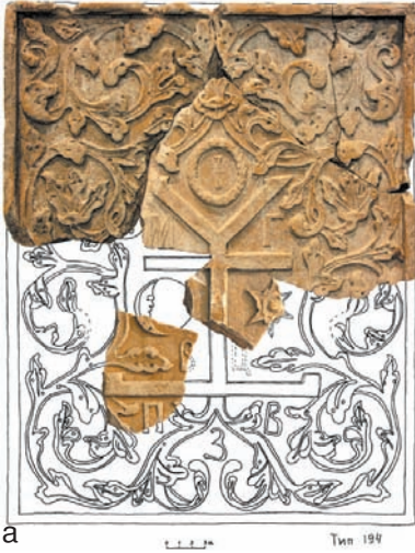
Комп'ютерні реконструкції фрагментованої теракотової плити з гербом та монограмою Мазепи від оздоблення екстер'єру його палацу на Гончарівці, 2010 р.: В. Сидоренка за фото В. Мезенцева (а), С. Дмитрієнка та В. Мезенцева (б).

Розвідкові археологічні дослідження 1995-2010 рр. показали, що Мазепине подвір'я займало незначну площу коло 2,5 га на північно-східній ділянці території Гончарівки, оточеної валом (біля 9 га). Дотепер на її більшій частині на захід і південь від гетьманського двору знайдено ще мало слідів заселення у XVII-по-