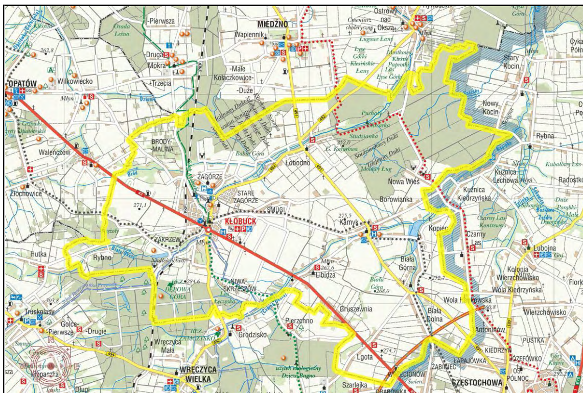
Rysunek 2. Plan Gminy Kłobuck

Plan Gminy Kłobuck przedstawiono na rys. 2.