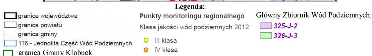
Rysunek 4. Lokalizacja punktów pomiarowych monitoringu wód podziemnych na terenie Gminy Kłobuck