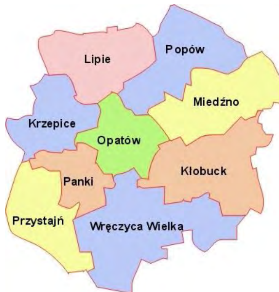
Rysunek 1. Lokalizacja Gminy Kłobuck na tle powiatu kłobuckiego

Gmina Kłobuck jest gminą miejsko-wiejską położoną we wschodniej części powiatu kłobuckiego. Od południa graniczy z Wręcycą Wielką, od zachodu z gminą Opatów, od północy z gminą Miedźno, a od wschodu i południowo-wschodu z gminami powiatu częstochowskiego - Mykanów, Częstochowa i Blachownia. Położenie gminy na tle powiatu przedstawiono na rys. 1.