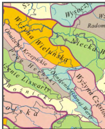
Rysunek 3. Rejonizacja J. Kondrackiego, 2002 r.

Mezoregiony: Wyżyna Wieluńska (na krańcach północno-wschodnich), Obniżenie Górnej Warty (na krańcach południowo-wschodnich), oraz Obniżenie Krzepickie (na krańcach południowo-zachodnich).