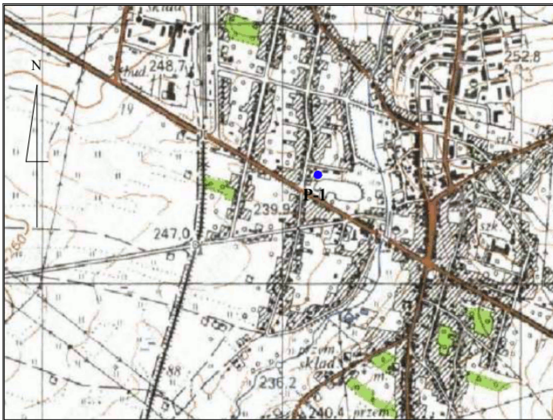
Rysunek 6. Położenie punktu pomiarowego promieniowania elektromagnetycznego w ramach Państwowego Monitoringu Środowiska

W ramach Państwowego Monitoringu Środowiska w latach 2010 – 2012, WIOŚ skontrolował po 45 punktów na terenie województwa śląskiego, z czego tylko jeden punkt zlokalizowany był na terenie Gminy Kłobuck. Miejsce kontroli usytuowane zostało w mieście Kłobuck na ul. Wielińskiej, które zostało zakwalifikowane do kategorii „pozostałe miasta”. Pomiar wykonany 18 maja 2011r. wykazał natężenie pola elektrycznego 0,70 V/m, w związku z czym nie stwierdzono wartości ponadnormatywnej. Lokalizację punktu przedstawiono na rys. 6. Warto nadmienić, iż zostanie on ponownie skontrolowany w 2014 r.