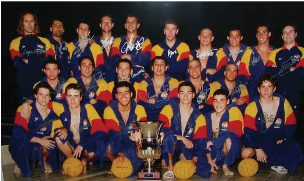
Campions de la Copa d'Europa (1995)

*INTERNACIONAL: 2 vegades Campió de la Súper-Copa d'Europa (1992 i 1995). Campió de la Recopa d'Europa (1992) i Sots-campió (1986). Campió de la Copa d'Europa (1995) i Sots-campió (1994)