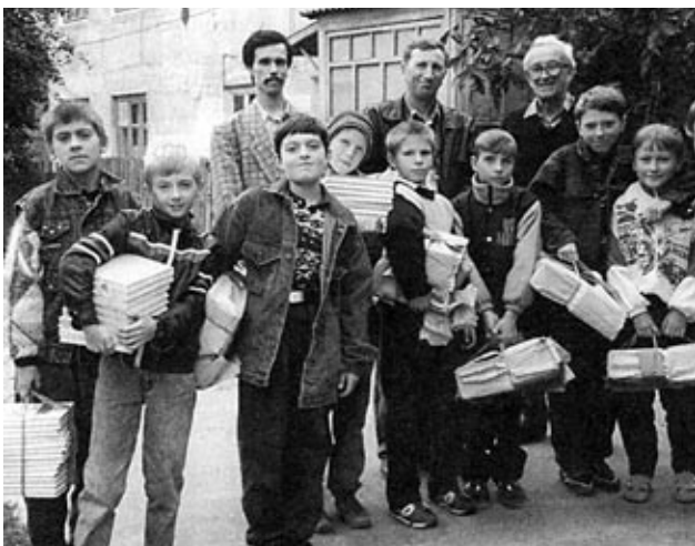
Цюрупинські школярі отримують підручники, привезені зі Львова

У жовтні 1991 р. у Цюрупинську на державному рівні святкували 500-річчя козацької слави та 280-ліття заснування Олешківської Січі, на яке запросили і львів'ян. Святкування відбувалися в Херсоні. Доцент Й. Саяк приїхав зі священиком о. Романом із Яворова та Новояворівським хором у прекрасних народних строях. Львів'яни, небайдужі до національного відродження південної України, привезли у ви-