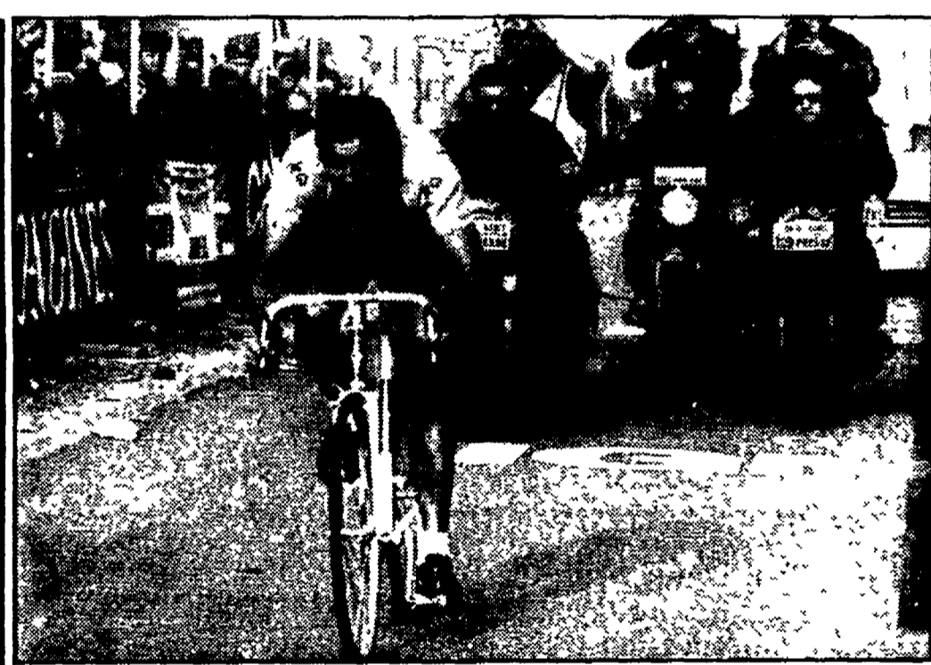
Eddy Merckx, cinque trionfi nel Giro d'Italia, 76 giorni in maglie rosa

GRAN PREMIO DEI GIOVANI: 1. Motet in 39.02'11"; 2. Veggerby a 23'55"; 3. Dalla Rizza a 43'06"; 4. Festa a 47'10"; 5. Ibanez a 55'55". CLASSIFICA CRONOMETRI: 1. Moser in 1.43'10"; 2. Freuler a 4'26"; 3. Fignon a 4'27"; 4. Cavigler a 5'10"; 5. Argentin a 5'47". TROFEO FIAT UNO: 1. Morandini punti 18; 2. Van der Velde 12; 3. Fignon 10; 4. Lejarreta 9; 5. Noris e Leali 8. PREMIO DELL'AGONISMO: 1. Gisiger punti 24; 2. Renosto 15; 3. Petersen 11; 4. Segersall e J. Fernandez 8. CLASSIFICA A SQUADRE: 1. Renault in 293.48'95"; 2. Murella-Rossin 293.51'19"; 3. Carrera-Inoxpran 294.02'28"; 4. Del Tongo-Colnago 294.15'15"; 5. Alfa Lum 294.15'31".