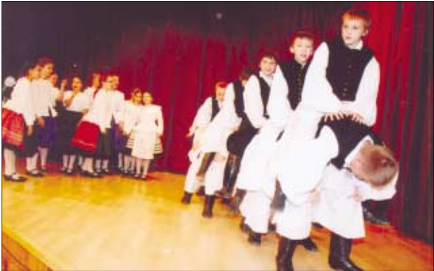
A gyermektáncosok nagy sikerű műsort adtak a nagycsaládosok karácsonyán, tavaly december 14-én az Óbudai Kulturális Központ-Békásmegyeri Közösségi Házban

A Kincső Együttes tavaly is többször tett eleget annak a megtisztelő felkérésnek, hogy a Hagyományok Háza színpadán az Állami Népi Együttest helyettesítse.