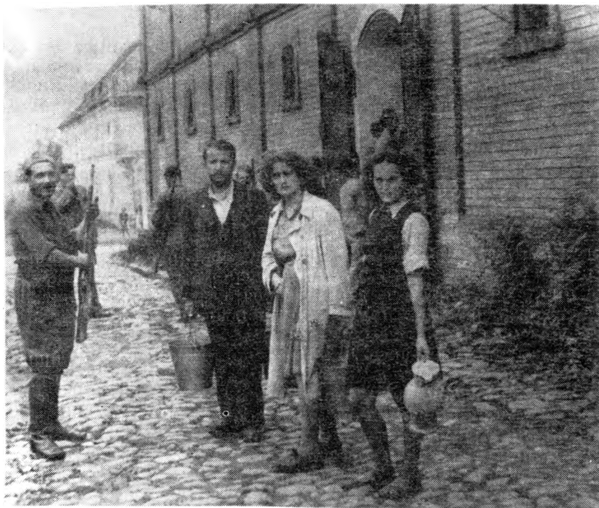
Zatvorenici ispred »Crvenog magacina« u Vukovaru

Sutradan 27.VIII 1942. formirana je naročita kompozicija od 20 vagona, koja je obuhvatala veliki broj zatvorenika, izuzev onih koji su bili sprovedeni u Sremsku Mitrovicu. Ova je kompozicija putovala samostalno, pa je provela dva dana i dve noći na putu do Jasenovca.