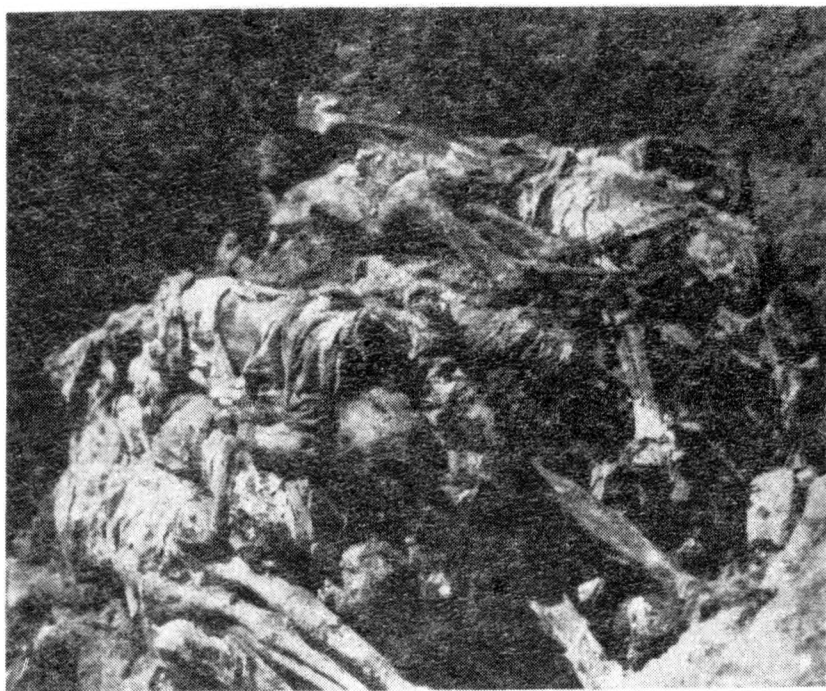
Otkopavanje žrtava u Dudiku