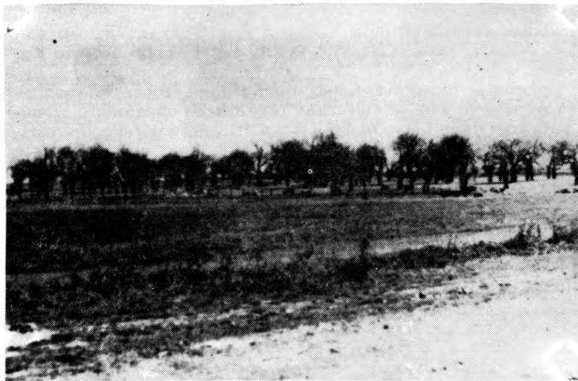
Dudik kraj Vukovara

Sličan slučaj dogodio se ranije, kada je jedan osuđenik u sumraku nakon izlaska iz kamiona pokušao beg. Bio je vezanih ruku u trku je pao preko busa i nije se mogao dići, ni ovaj puta nisam čuo pucanj nego neko komešanje na zemlji od mene oko 30 koraka udaljeno a zatim nošenje u jamu.»