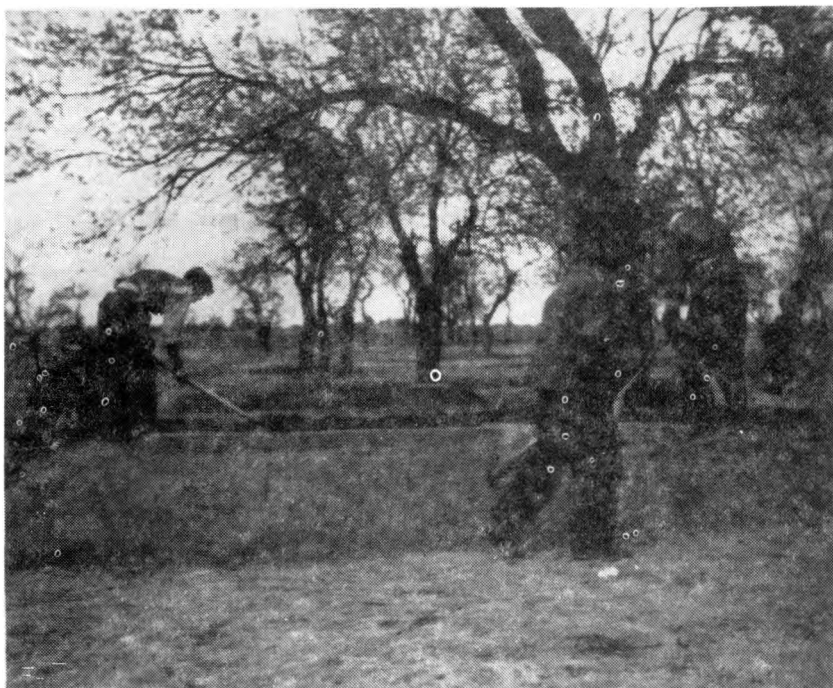
Grobnice u Dudiku posle exhumacije