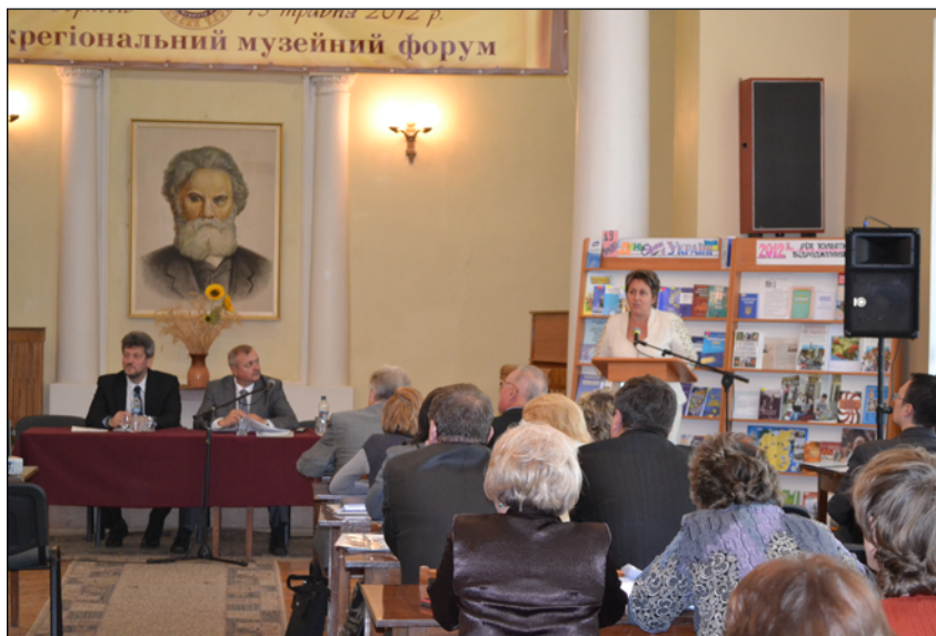
Пленарне засідання Міжрегіонального музейного форуму в м.Чернігові, фото 15 травня 2012р.

20 червня в залах Конотопського міського краєзнавчого музею імені Олександра Лазаревського відбулася презентація виставки «Немеркнуча слава козацького духу» із фондової колекції Національного заповідника «Гетьманська столиця». Виставка складається із 17 картин, серед яких роботи Олеса Соло-