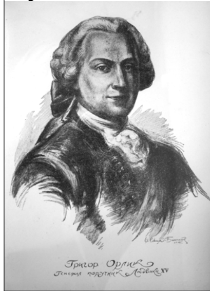
Григорій Орлик.

Багато уваги дослідники приділяли П. С. Орлику як політичному діячеві, та авторів першої української Конституції. Але поза увагою залишаються ті близькі люди, які плекали в ньому надії на краще майбутнє, любили не залежно від політичної ситуації.