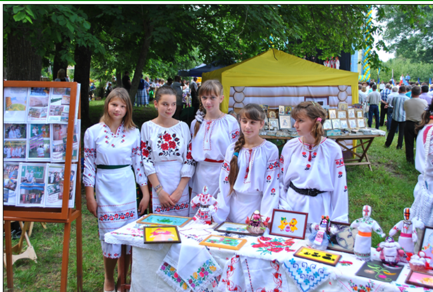
Експозиція Козацької держави Батуринської ЗОШ I-III ст., фото 10 червня 2012 р.