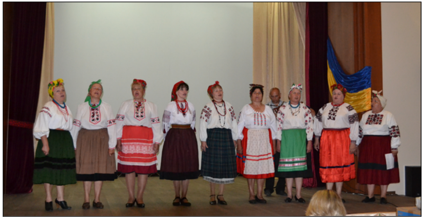
Музичне привітання колективу заповідника з Днем музеїв, хор «Козацька душа» Батуринського БК, фото 18 травня 2012 р.

Після основної частини пленарного засідання форуму його організатори привітали музейних працівників з професійним святом – Міжнародним днем музеїв, від імені ЧОДА було вручено грамоти, дипломи, подяки і квіти працівникам музейної справи, які виявили особливий професіоналізм і старанність в роботі. Серед них і співробітники заповідника "Гетьманська столиця" генеральний ди-