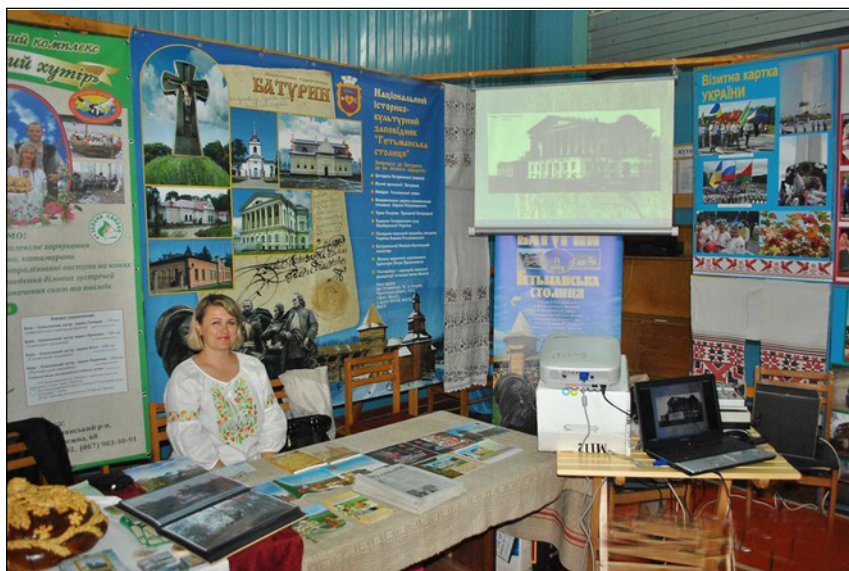
Міжрегіональний туристичний форум “Чернігівщина туристична 2012”, фото 19 травня 2012 р.