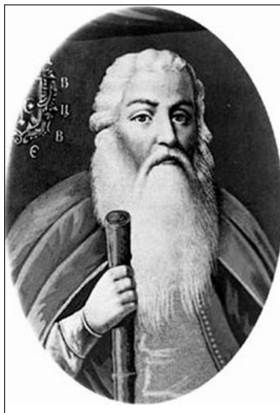
Портрет генерального судді І.М. Домонтовича.

науковий співробітник заповідника „Гетьманська столиця”