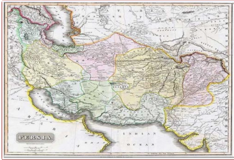
(نقشه ایران در ۱۸۱۴م/۱۱۹۳.ه.ش)