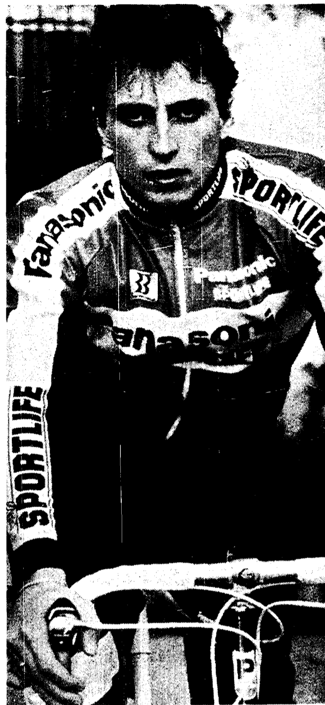
Maurizio Fondriest, 26 anni, campione del mondo due anni fa, è emigrato in Belgio ed è uno dei grandi assenti del Giro; in basso Moreno Argentin, vincitore di classiche. Anche lui disserterà la corsa rosa

Il campo dei partecipanti al 74° Giro d'Italia sarà composto da 20 squadre (10 italiane e 10 straniere) di nove corridori ciascuna. In lizza 180 concorrenti.