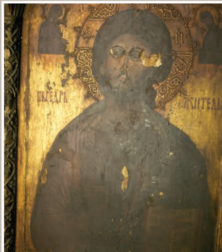
Detalii Pictură pe Lemn