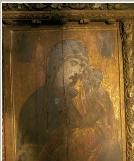
Detalii Pictură pe Lemn