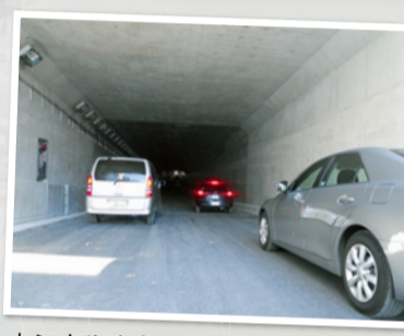
トンネル内(車両走行イメージ) (27年1月撮影)