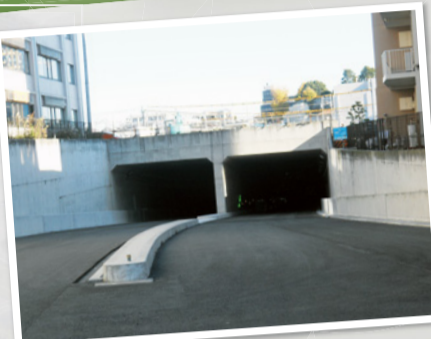
トンネル開口部 清源院入口交差点側 (26年12月撮影) 幅員:約20m(上下各2車線)