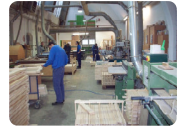
Schreinerei – Produkte für Büro, Wohnen, Leben