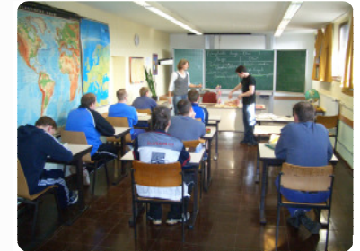
Wege zum Schulabschluss im Pädagogischen Zentrum