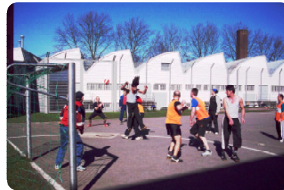
Gefangene beim Sport