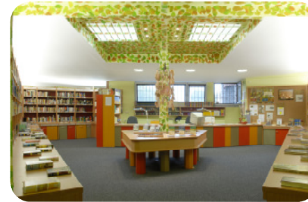
Gefangenenbücherei Trägerin des Deutschen Bibliothekspreises „Bücherei des Jahres 2007“