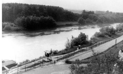
Hraničné pásmo pri Morave.

Súčasťou hraničného pásma boli tri ploty. Prvý, asi dva metre vysoký, tvorila spleť ostnatých drôtov. Ďalší plot, vysoký 2,5 metra, bol nabitý elektrickým napätím. Posledný plot slúžil ako zábrana pre zver. Pod plotmi sa nachádzalo zorané pásmo široké cca 20 m, aby sa dali nájsť stopy utečencov a miesto, kde prekonal plot. Ploty sa nachádzali cca 2 km od hranice, aby aj v prípade jeho prekonania stihli pohraničníci chytiť narušiteľa skôr, ako sa dostal za hranicu. Pozdĺž hranice navyše viedla v asi kilometrovej vzdialenosti asfaltová komunikácia, ktorá pohraničníkom uľahčovala výjazd k miestu zásahu. Každý zaznamenaný útek bol podrobne dokumentovaný, aby sa v budúcnosti predišlo jeho opakovaniu. Úteky sa netýkali len civilného obyvateľstva, ale vyskytli sa aj nelegálne prechody hraníc príslušníkmi pohraničných jednotiek a vojakov základnej vojenskej služby (zbehovci).