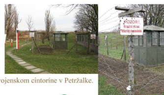
Náznaková rekonštrukcia hraničného pásma pri vojenskom cintoríne v Petržalke.

„... My sme žili v zakázanom pásme, nevnímali sme to až tak strašne, ploty sme videli od všadiaľ, drôty boli z každej strany. V občianskom preukaze som mal povolenie na vstup do zakázaného pásma. Bývali sme od hraníc pár kilometrov, čo bolo zakázané pásmo okolo celej republiky. Družstevníci tam chodili, v pásme bývali ľudia, ale museli mať povolenie na vstup. Ako žiak som mal aj v čiackej knižke napísané, že bývam v zakázanom pásme. Neskôr sa priestor zakázaného pásma zužoval, až ho zrušili úplne...“