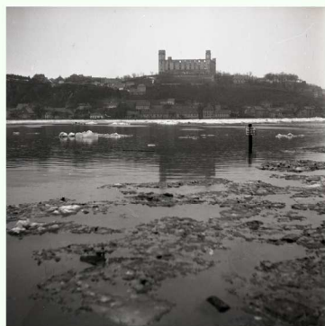
Pri brehu Pečnianskeho ramena počas povodne z roku 1956. Vo vode je vidieť tabuľu upozorňujúcu na štátnu hranicu.

Ochranu štátnej hranice zabezpečoval aj podnik Matador. S vojakmi na štátnej hranici spolupracoval už od roku 1948. V roku 1973 mal 70 pomocníkov pohraničnej stráže, pri príležitosti 29. výročia SNP v roku 1973 mu Národný výbor Bratislava IV. udelil titul „Vzorný pohraničný závod“.