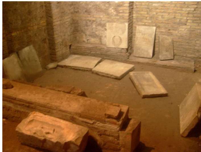
E lastre ricacciate da i scavi, sottu a chjesa attuale.

Ste poche infurmazioni l'emu raccolte, micca in u scopu di custruì ci sopra un istudiu, postu chì bella sicura ci manca u zocculu essenziale, vale à dì a ricerca uriginale, da pudè chjappà l'attenzione di i circadori sopr'à un sugettu di grande interessu per a Corsica : A ricerca di i so emigrati in Roma à traversu i documenti di l'archivii, pocu è micca sbulicati à tale scopu, è i munimenti sepulcrali in e chjese. Di questi munimenti serà stata certamente tamanta a pèrdita è a sparghjera, ma i registri paruchjali, duve è quandu elli esistenu, i registri funerali è altri codici è libri santi ponu ancu fà contrapesu in parechji casi, è cusì dà a pussibilità à u circadore di ricustruì in bella parte, in tèrmine di quantità, di qualità è cù i ritratti di i so omi è donne, a culunia corsa chì nant' à u sugliare di a tomba di l'Apòstuli, campò, si dete ànimu, prusperò, à paru à tant'altre culunie taliane è straniere.