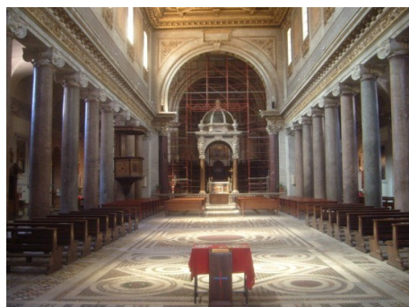
A navata centrale.

A Corsica ùn fù di quelle e più cuccagnate, frà tutte e terre è isuloni mediterràni di u Imperu Romanu à i tempi di u passagiu da u paganisimu à quella nova religione venuta da l'oriente. Ma San Gregoriu Magnu, chì tantu si dete ànimu pè racoglie à a Croce tutti i paesi, ancu i più alluntanati, cunquistati tempi fà da l'acule romane, ùn si dimenticò di quell'isula santificata da u sangue di Ghjulia a vèrgine, è culà dinò ci mandò i so messageri di pace è d'amore, da prumove ci l'edificazione di chjese è munasteri beneditini. Da tandu mai ùn smesse a grande primura di i pontifici per i Corsi, è Leone IX, chì i sapia battaglieri ma fidi, propriu à elli turnò l'invitu ch'elli venghinu à culunizà u portu di Roma, risanatu dipoi pocu, da difende lu contr'à i nemici crudeli di a fede.