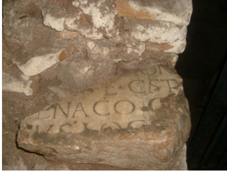
Pezzu di lastra adupratu da petra in un muru. Ci si pò leghje "Venaco".

in u 1573 usonu u so dirittu di sepultura per elli è per i soi à vene, in una tomba propriu in a navata à diritta, dinanz' à a sesta colonna.