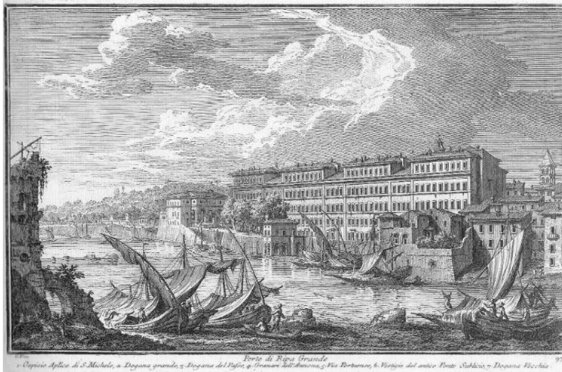
U portu di Ripa Grande in u Trastèvere, Roma.

In fatti, sapemu chì u cummerciu di i Sardi tuccava principalmente à u ligname, à l'oliu, à e biade, mentre chì i Corsi si davanu piuttosto à u tràfficu di u pesciu, cum'è l'emu detta, di u vinu, di u bestiame, è tenianu negozi di salumeria è altra roba simile. I Corsi invece mai a si fecenu in pace cù quelli di Ghjenuva, puru abitanti anch'elli di u Trastèvere duve ancu oghje anu a so chjesa è a so cunfraterna, è spessu cun elli nascianu l'azzuffi, forse pè cuncurrenza nant'à i mercati o pè altra cagione. Sia cum'ella sia, tale antipatia puderebbe spiecà e ragioni di quellu spìritu di nemicizia sempre cuvatu da i Corsi contr'à i Ghjenuvesi, è l'origine iniziale ne puderebbe ancu esse tutt'altra chè pulitica.