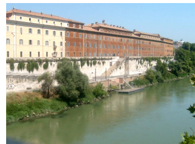
Ripa Grande, oghje ghjornu.