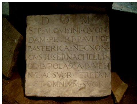
Lastra di Pietro Paolo de Basterica è Giusti Sernachelli de Lupolasca (Pupulasca).

A più antica lastra tumbale, in a navata manca di a chjesa, nant'à u pavimentu vicinu à a settèsima colonna (secondu l'indicazioni di Forcella) ammenta u ricordu d'una donna. A scritta in epigrafa ci insegna ch'ella si chiamava Anastasia è era a figliola di Nicolò Còrso de Tavera . Si ne morse à vintisei anni, in u 1527, l'annata di u cusì famosu saccheghjù di Roma : Qual'hè chì sà s'è a fine primaticcia di sta giovanotta fù cagiunata da quellu crudele evenimentu ? A scritta sepulcrale fù dedicata à a defunta da Caterina , moglie di Nicolò , senza però accennà nisuna lea di sangue più stretta frà e duie donne, nè qualchì particolare dolore di a matrigna pè a giovane scumparsa.