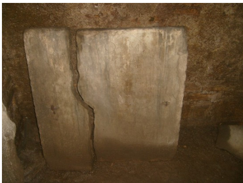
Lastra di Lealpheo a Monte Maione Corsicæ.

XII - Horatius - Castellani corsi socero et uxori moestis. p. Più impurtante hè un'altra scritta, ricacciata da Forcelli da un codice Chigiano (ndt : raccolta manuscritta di crònache descrivendu l'usi è custumi di l'Italia cumunale in u Medievu) è chì ci parla di u strenuus capitaneus Salvator de Levia corsus - qui cum in obsidione Parmae ad servitia - inclytae familiae Farnesiae viriliter mili interfectus fuit. Hic iacet (aghjunghje u scrittore di manera pumposa) et cum eo - fides valor et probitas iacent. Si ne morse De Levia à quarantacinque anni, in u 1551, durante l'assedi lampatu sopr'à Parma dopu l'assassiniu di Pier Luigi Farnese . Cascatu mentre ch'ellu fecia valorosamente u so dovere, da un colpu lampatu da quelle antiche mascine di guerra chì vumitavanu e petre, cum'è ne testimoniegghja u documentu, a so salma fù ricuarata à