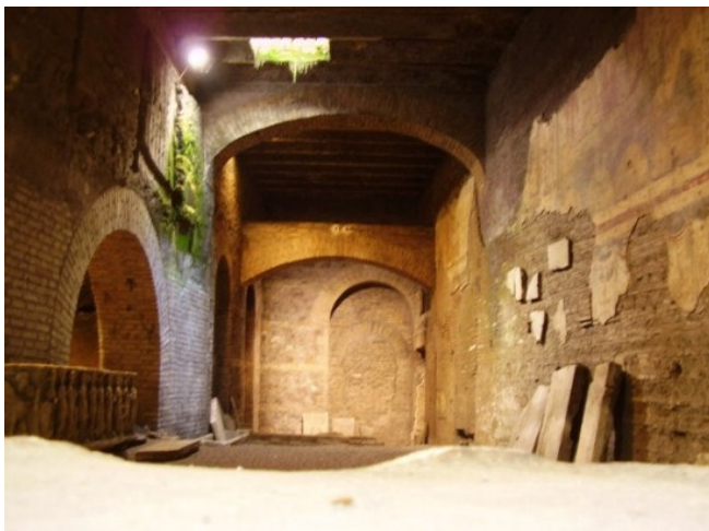
I scavi di a basilica cristiana, sottu a chjesa attuale.

Secondu Tencajoli, e lastre e più antiche ricollanu à u puntificatu di Eugeniu IV (primi decenni di u XVu sèculu), ma quelle chì Forcella ne pubblicò e scritte inizianu un bellu sèculu dopu, vale à dì in u 1527, è vanu finalmente à u 1589. Ùn pare tantu creditoghja chì e salme corse fussionsu ghjunte sott' à e navate di San Crisògonu solu mentre stu cortu pezzu di tempu, ma cunvene piuttosto à ritene chì quelle di prima fussionsu state sparserse in l'òpere prufonde di ristrutturazioni è rimanighjate patute da a chjesa versu u 1623 sottu a direzione di Soria, è per vuluntà di u cardinale Scipione Borghese, chì in e memorie lasciò tanti ricordi di a so generosità. Custi si trattava di sèmplice lastre vechje è fruste, chì funu lampate via perchè forse mancu più si trovavanu in Roma