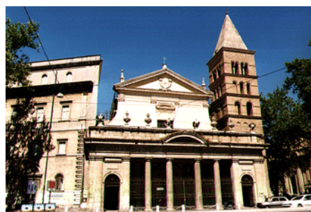
San Crisògonu, oghje ghjornu.

Ci vole à dì ch'in stu locu, piacèvule à stà ci quant'è un altru quartieru di Roma, eranu ghjunti à stallà si ancu i Sardi, prima o dopu à i Corsi ùn si sà, ma più o menu à listessa èpica à ciò chì pare. A culunia sarda, più numerosa, fecia dinò valè origine più nobile è innalzate da una legenda eròica, postu chì u so fundatore è antenatu si dava parentia cù u guerrieru Ilario Cao , chì, rispundendu à a chjama di u Papa, averebbe liberatu a Sardegna da i Saracini. I dui pòpuli isulani, cusì vicini, a si passavanu in una armunia quasi fraterna, forse dinò perchè chì e so faccende rispettive, diverse è dunque micca cuntrarie à i tornaconti di l'uni è di l'altri, permettianu in pàtria un bellu