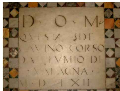
Questae S. De Gavino Corso da Lumio de Valagna M.D. LXII.

Hè cosa cunnosciuta chì pè longu tempu i Corsi furmonu quasi u nervu di a piccula armata pontifice, finchè Lisandru VII, ùn pudendu sfidà a zerga di u Rè Sole, fù custrettu à licenzià li tutti. Dunque, fin' à a seconda metà di u XVIIu sèculu, sullati corsi in Roma ci n'era à centinaia. Purtantu, da ciò ch'ellu scriveva Trasselli, nomi di sèmplici militari isulani ùn si ne trova in i ceppi di nutaru cunsultati da ellu, invece chì sò frequenti i nomi di capitani. Listessu affare pudemu di di e sepolture di San Crisògonu postu chì, nant' à una vintina di scritte, militare corsu ùn si ne scontra manc' unu, ma invece sei capitani o alti ufficiali. Nant' à u muru di a navata à diritta, contr' à a seconda colonna, si pò leghje st'epigrafa di u 1547 : Pasquino Corso Milit. Tribuno rebus - strenue genstis clarissimo qui magnis - partis honoribus magno omnium cum - moerore die XV Julii M. D. XXXII obit (sic) - et Lucretiae eius filiae pudicitia et - moribus insigni immaturae ab humanis - ereptae XIX Julii M. D. XLVII quae vixit - ann. XV mm. VI dd.