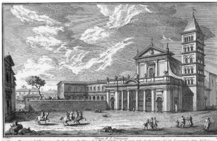
Chjesa di San Crisògonu, Roma.

A Corsica ùn fù di quelle e più cuccagnate, frà tutte e terre è isuloni mediterràni di u Imperu Romanu à i tempi di u passagiu da u paganisimu à quella nova religione venuta da l'oriente. Ma San Gregoriu Magnu, chì tantu si dete ànimu pè racoglie à a Croce tutti i paesi, ancu i più alluntanati, cunquistati tempi fà da l'acule romane, ùn si dimenticò di quell'isula santificata da u sangue di Ghjulia a vèrgine, è culà dinò ci mandò i so messageri di pace è d'amore, da prumove ci l'edificazione di chjese è munasteri beneditini. Da tandu mai ùn smesse a grande primura di i pontifici per i Corsi, è Leone IX, chì i sapia battaglieri ma fidi, propriu à elli turnò l'invitu ch'elli venghinu à culunizà u portu di Roma, risanatu dipoi pocu, da difende lu contr'à i nemici crudeli di a fede.