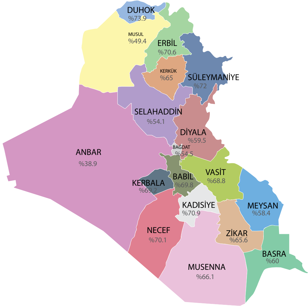
Grafik - 2 2014 Irak Genel Seçimleri İllere Göre Katılım Oranları

Genel seçimlerle birlikte Irak Kürt Bölgesel Yönetimi'nde (IKBY) de yerel seçimler gerçekleştirilmiştir. 19 Mayıs 2014 tarihi itibarıyla Irak genel seçimlerine ilişkin ilk resmi sonuçlar Irak