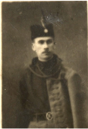
Slika 5. U sokolskoj uniformi 1927. godine.

„Vežbaonica, neka vrsta prve niške fiskulturne sale, nalazila se u staroj Osnovnoj školi kod Saborne crkve. Ovo gimnastičko društvo je već 1905. godine počelo da daje časove gimnastike učenicima osnovne škole“ (10:537). Viteško društvo „Dušan Silni“, primalo je u članstvo sve građane Niša koji su ispunjavali određene uslove. Godine 1907. društvo je promenilo ime u „Gimnastičko društvo Soko“. Ovo društvo kasnije menja ime u „Sokolsko društvo Niš“ i nastavlja uspešno da radi do početka Drugog svetskog rata (7).