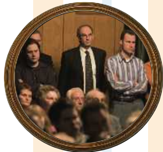
Job Cohen, burgemeester van Amsterdam, volgde incognito het debat met de oud-partijvoorzitters.