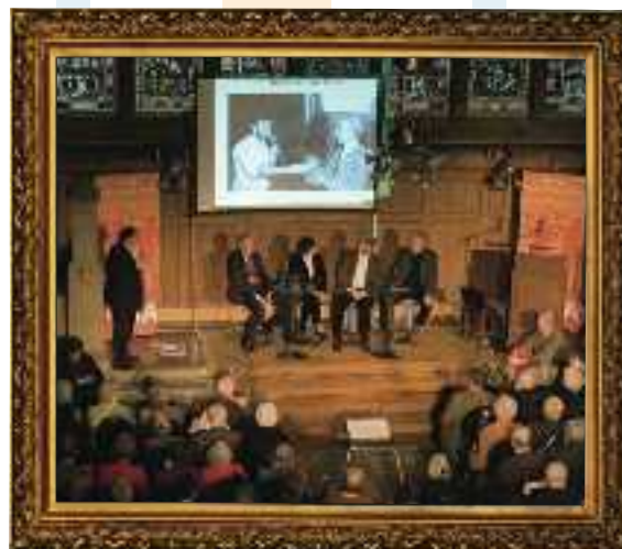
Journalist Max van Weezel leidde het debat met oud-fractievoorzitter Dick Dolman en oud-bewindslieden Hedy d'Ancona, Ed van Thijn en Bram Stemerding.

Herkenbaar voor velen: Felix Rottenberg legt zijn oud-collega voorzitter nog één keer uit hoe het zit.