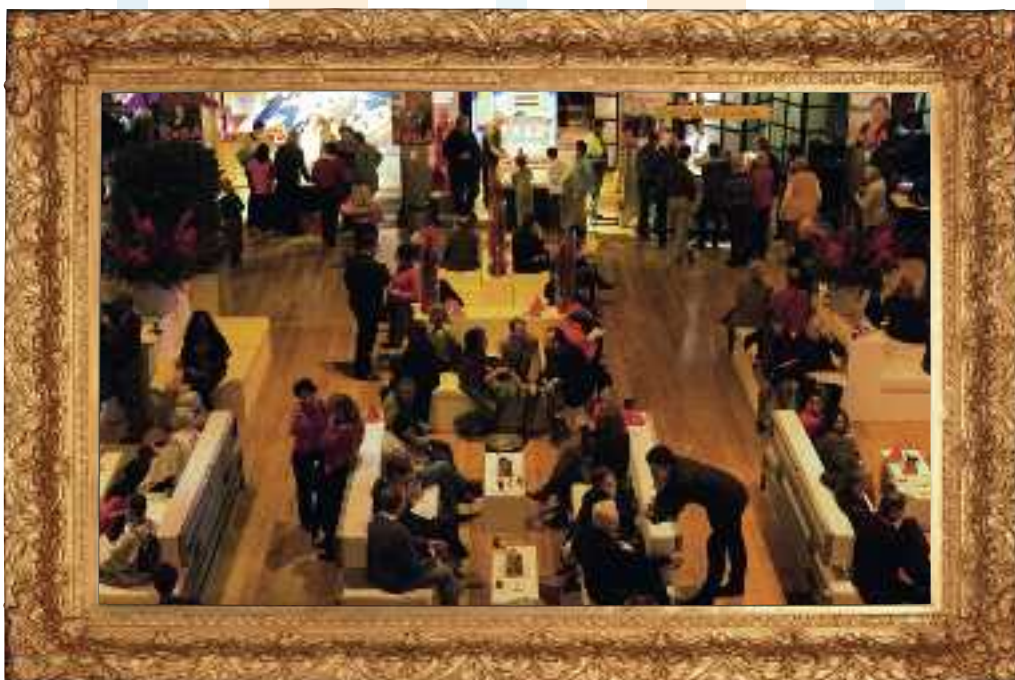
Op loungebanken werden herinneringen opgehaald, verhalen uitgewisseld en er werd gelachen en gedronken.