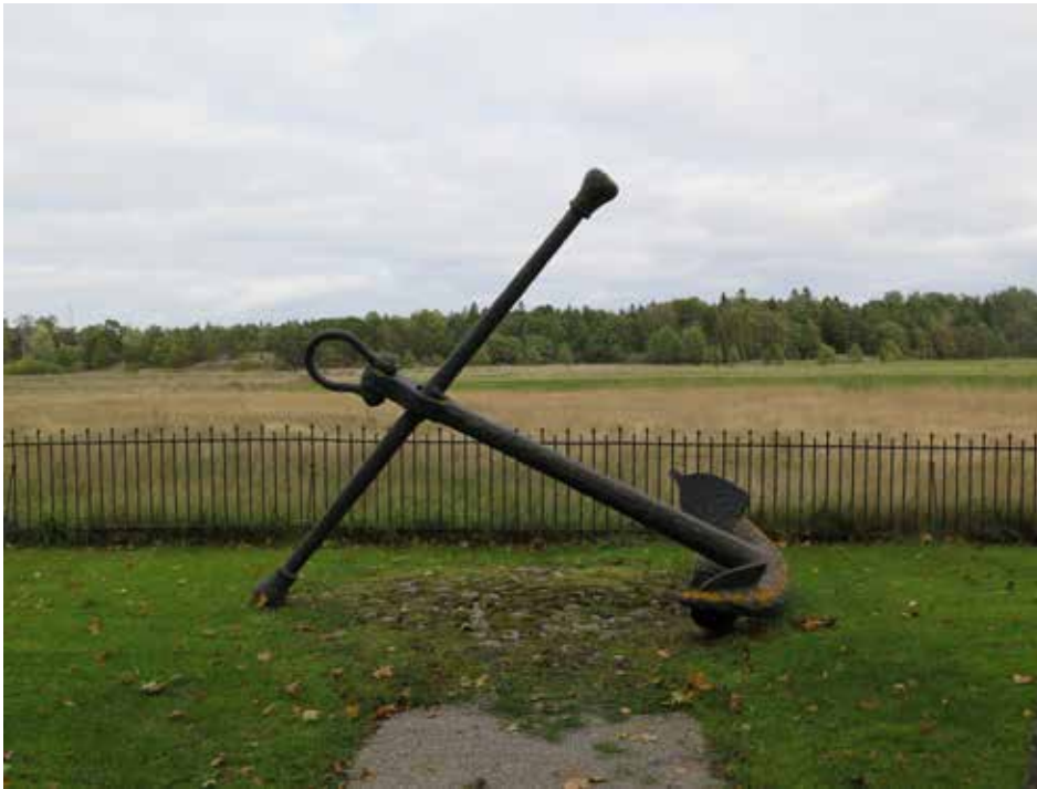
Fig.8. Skeppsankaret som skänktes till kyrkogården på 1960-talet. LP_2014_00240.

Kyrkogården delas in i två gravkvarter av den grusgång som går rakt över kyrkogården. Inne i kvarteren finns gräsmatta. På kyrkogården finns ingen minneslund eller askgravplats.