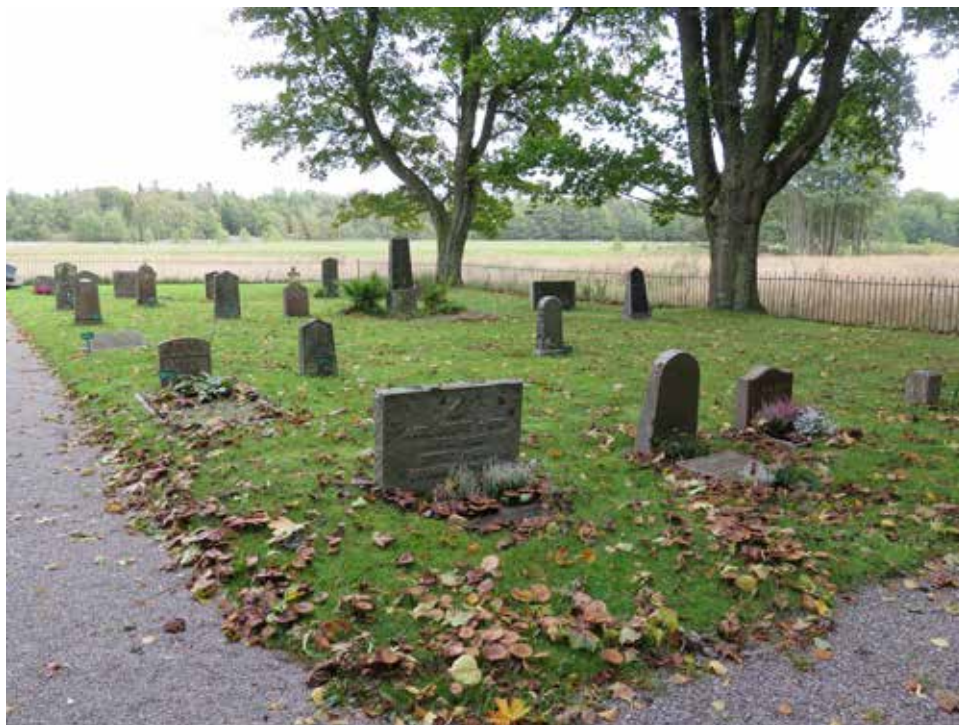
Fig.12. Den södra delen av kyrkogården. LP_2014_00244.