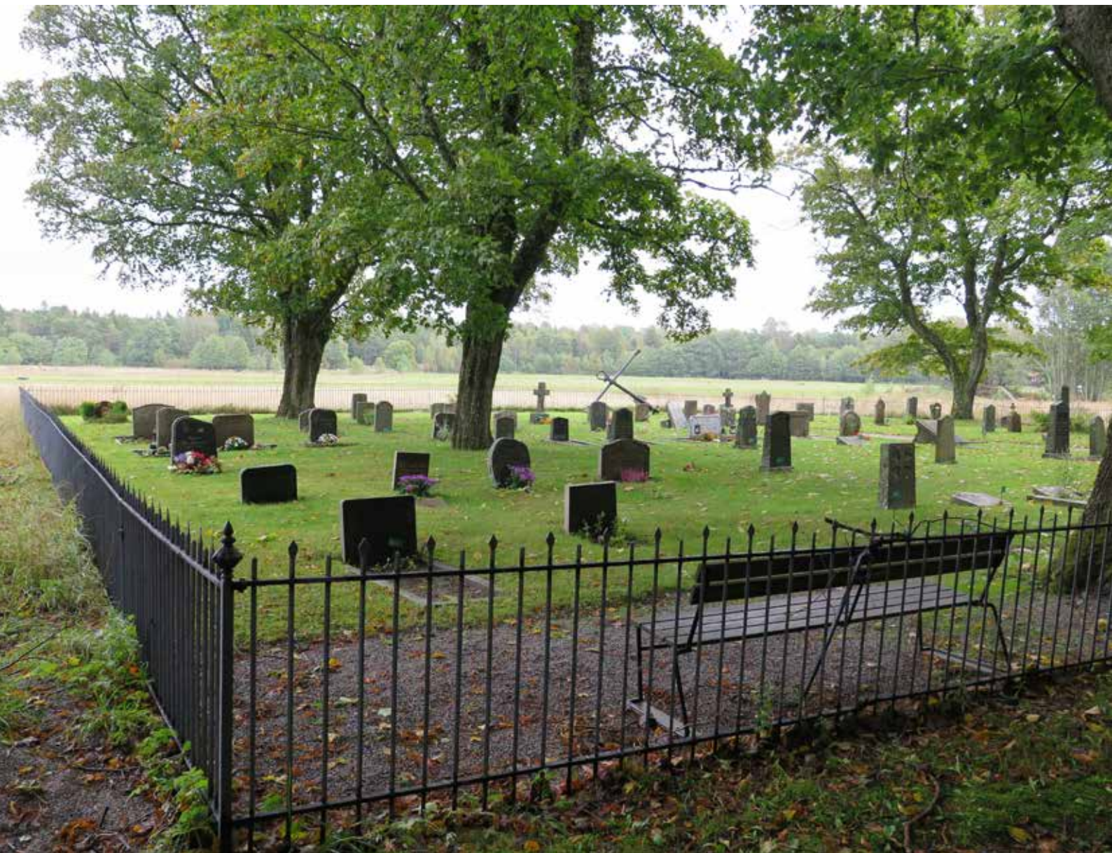
Fig.4. Kyrkogården har en nästintill kvadratisk form och omges av ett smidesstaket. Träden till vänster på fotografiet markerar kyrkogårdens tidigare gräns, innan utvidgningen på 1930-talet. LP_2014_00237.