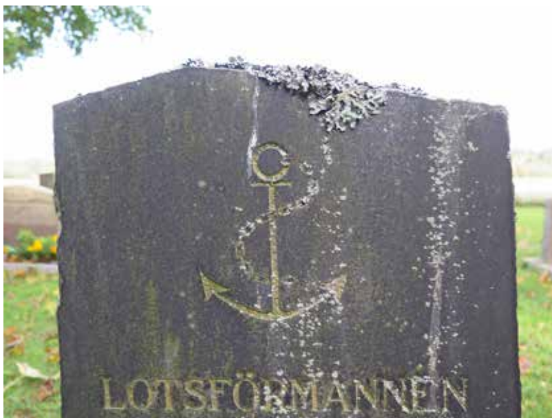
Fig.10. En av gravvårdarna med lokalhistoriskt intressant yrkestitel och symbol. LP_2014_00242.

Följande titlar förekommer på gravvårdar på kyrkogården: