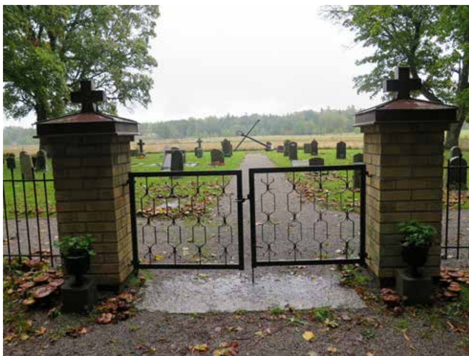
Fig.6. Kyrkogårdens ingång. Mellan grindstolparna ligger en gravhäll från 1700-talets mitt. LP_2014_00238.