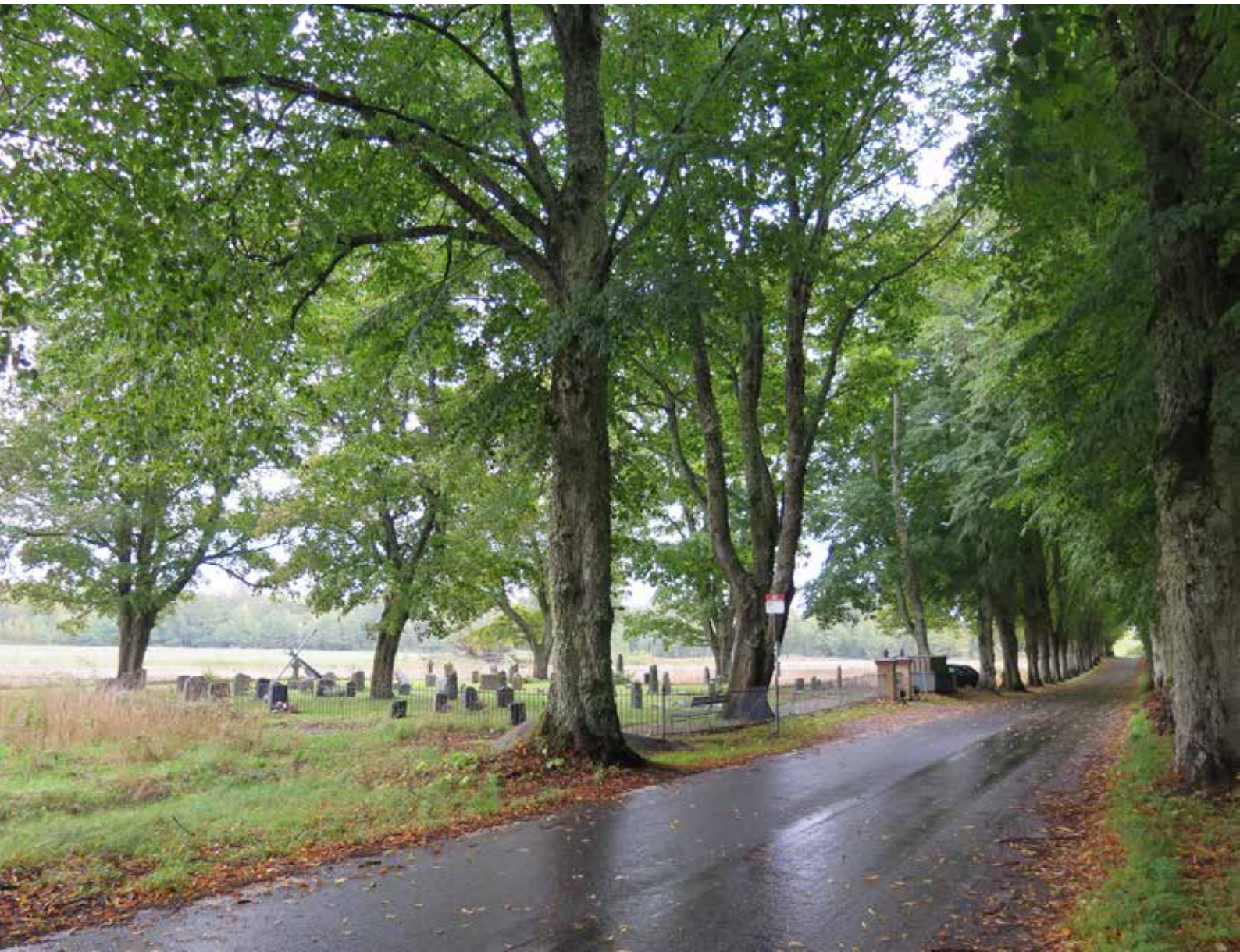
Fig.3. Lotskyrkogården ligger intill landsvägen, omgiven av ett öppet landskap i tre väderstreck. LP_2014_00236.