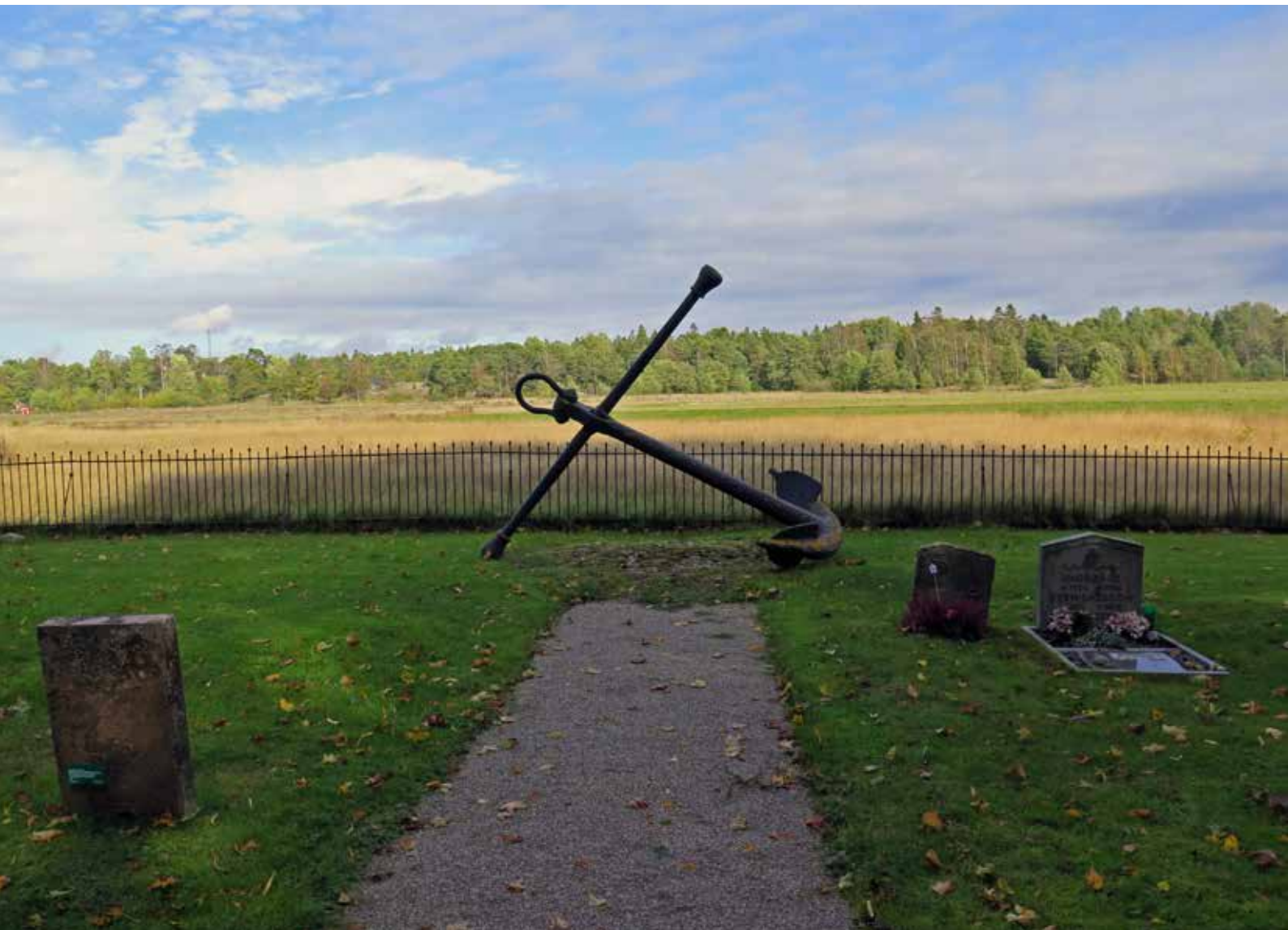
Fig.1. Ankaret på Lotskyrkogården och det omgivande öppna landskapet. LP_2014_00235.