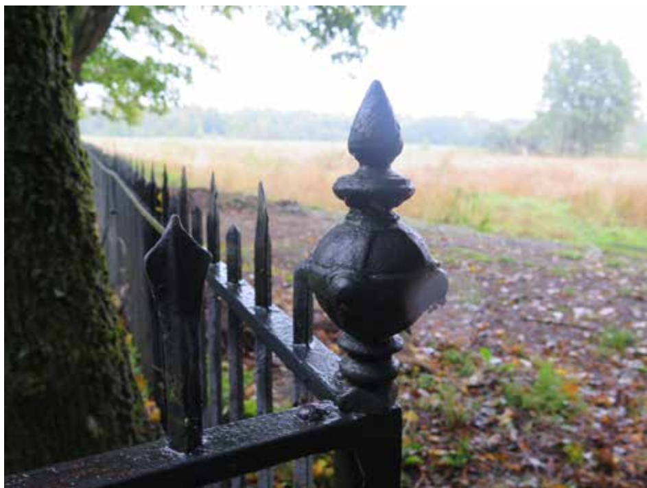
Fig.7. Detalj från staketet som omgärdar kyrkogården. LP_2014_00239.