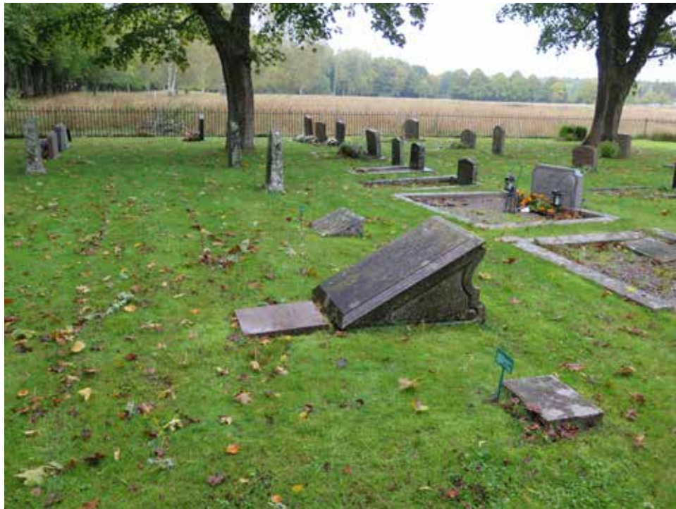
Fig.11. Del av kyrkogården. Några grusgravar finns. Från kyrkogården finns vyer ut över det öppna landskapet. LP_2014_00243