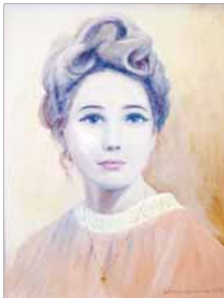
Н. Коркішко. «Автопортрет».

Авторка прагне вдосконалення техніки свого живопису, хоче зробити свої картини більш професійними й довершеними. Художник Іван Новобранець відзначив наївність як стильову осо-