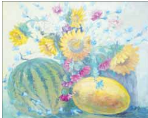
Н. Коркішко. «Щедре літо».