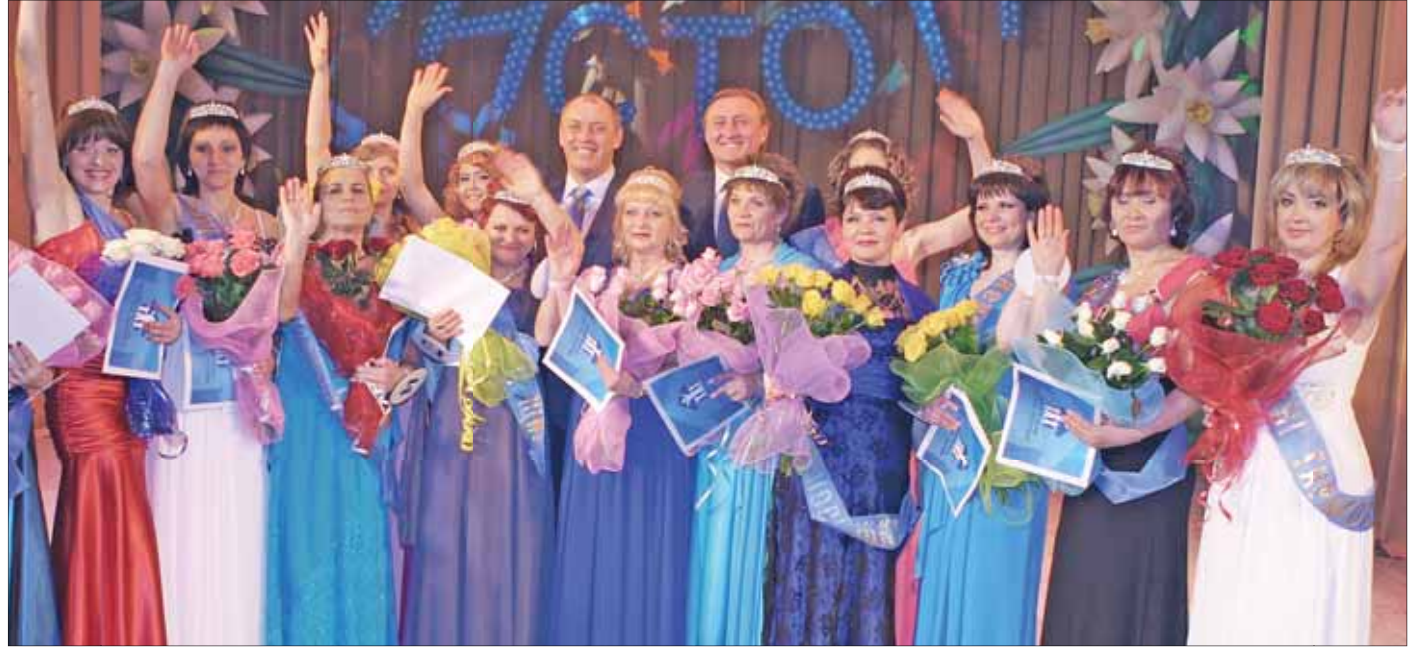
Учасниці конкурсу «Пані чистота-2012» подякували міському голові Олександр Мамаю і ГО «Наш дім – Полтава» за гарне свято.