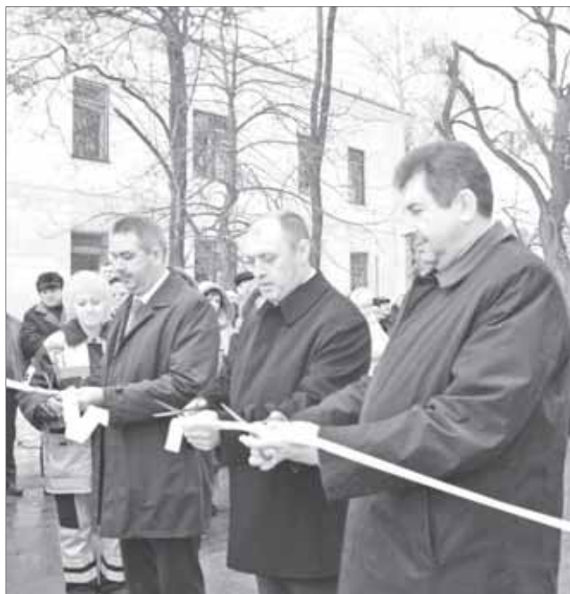
Урочистий момент перерізування стрічки.