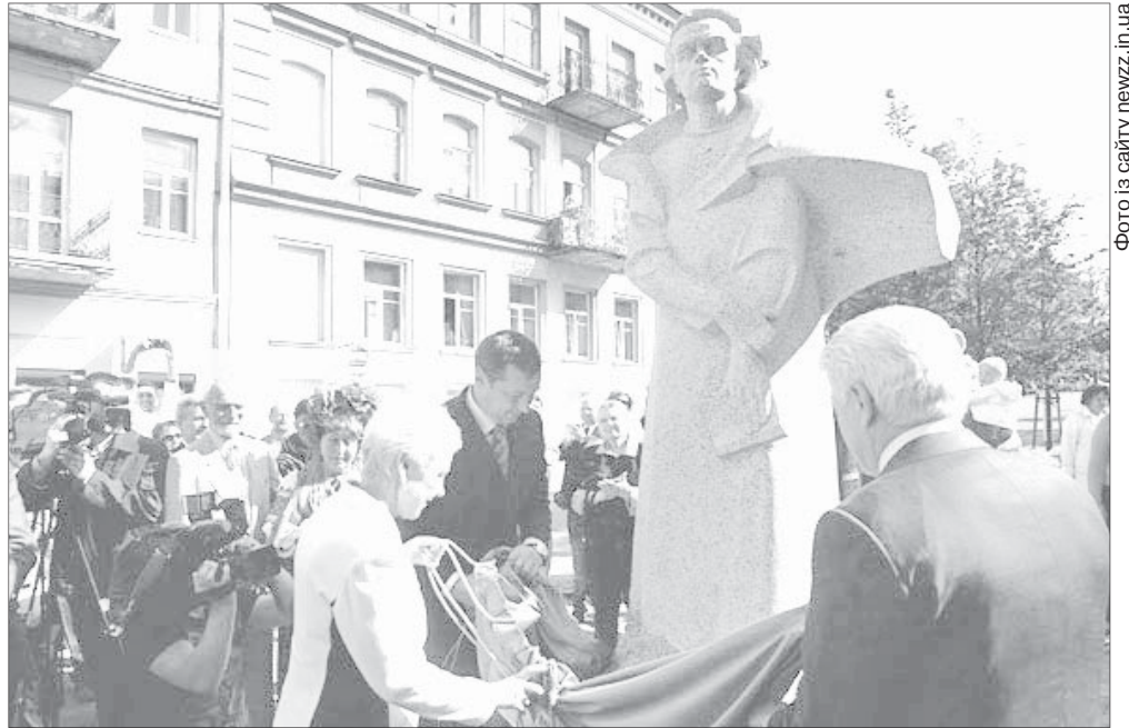
Торік у вересні у Вільнюсі відкрили пам'ятник Т. Г. Шевченку. Цю подію присвятили 180-й річниці з того часу, коли юний Тарас, одержавши вагомі уроки художньої майстерності, сформувався як майбутній художник.

Шевченко писав у автобіографії так: «Странствує с обозом за своїм дидьчем в Киев,