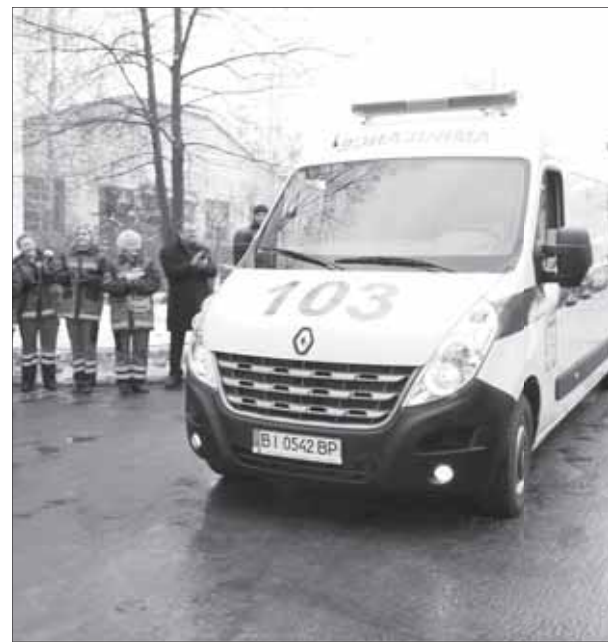
Цей реанімобіль уже можна буде побачити на вулицях міста.