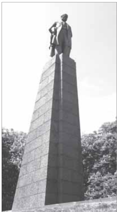
На могилі Т. Г. Шевченка.