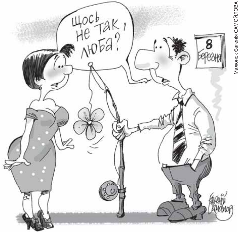
Малюнок Євгенія САМОЙЛОВА

А ще обов'язкове «доповнення» до подарунка дівчині чи дамі – квіти. Знайдеться дуже